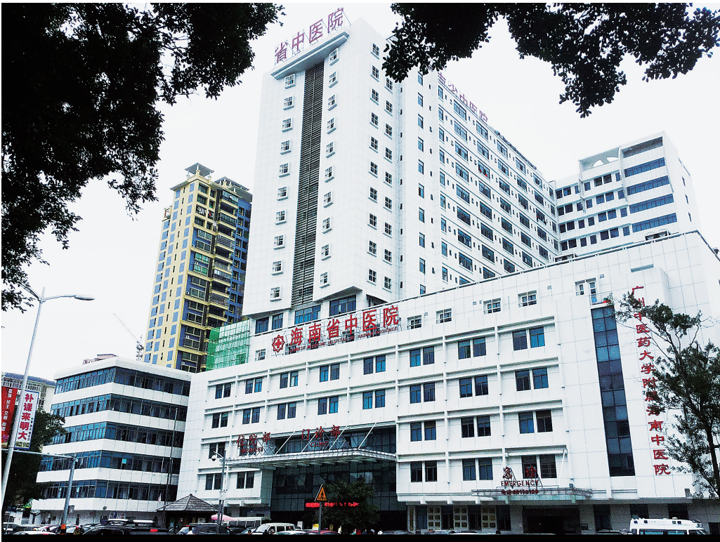
海南省中医院迈进全国先进中医医院序列