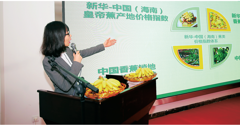
中国经济信息社指数中心 相关负责人介绍指数。

澄迈县政府在我省香蕉产业发展的艰难时期，勇于挑起担子，主动作为，与中国经济信息社一起共同打造“新华—中国（海南）皇帝蕉产地价格指数”，将为我省香蕉产业发展重振辉煌作出重要的贡献，也为澄迈县农业增效、农民增收、品牌农业打造、精准扶贫实施等创造条件与可能。