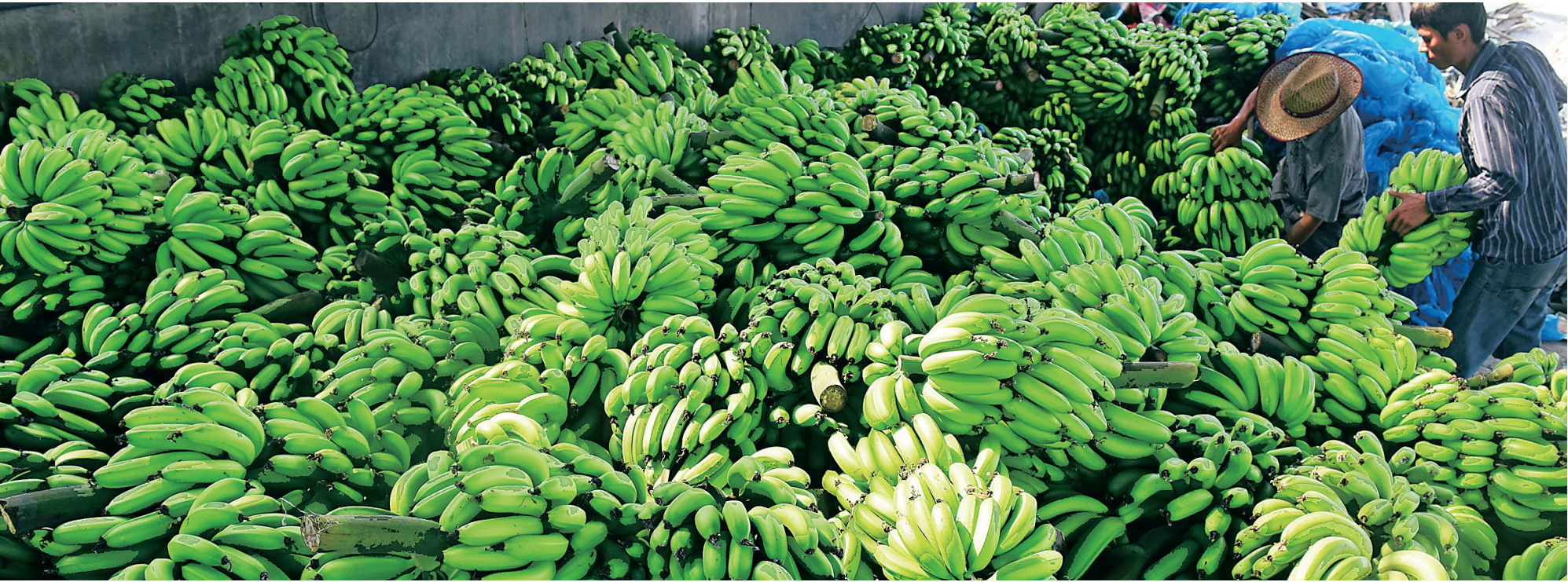
价格指数将助海南香蕉产业重振辉煌。

新华—中国（海南）皇帝蕉产地价格指数由中国经济信息社指数中心编制，是新华—中国（海南）蕉类价格指数体系中的重要组成部分，也是该体系中首个研发编制的单品类价格指数。后期将以此为基础，继续丰富完善样本，形成单品价格指数、分类价格指数以及综合价格指数等，构建中国蕉类价格指数体系。