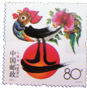
《乙酉年》邮票极限片。

四种贺年鸡票,不同的风格的风采,但主旨都一样,传播生肖文化,恭祝新年如意。人们喜爱收藏生肖邮票,除了欣赏它的艺术、感受它的魅力,留着自己的属相做纪念外,它的升值空间高于其他主题邮票,也是其中重要的原因。