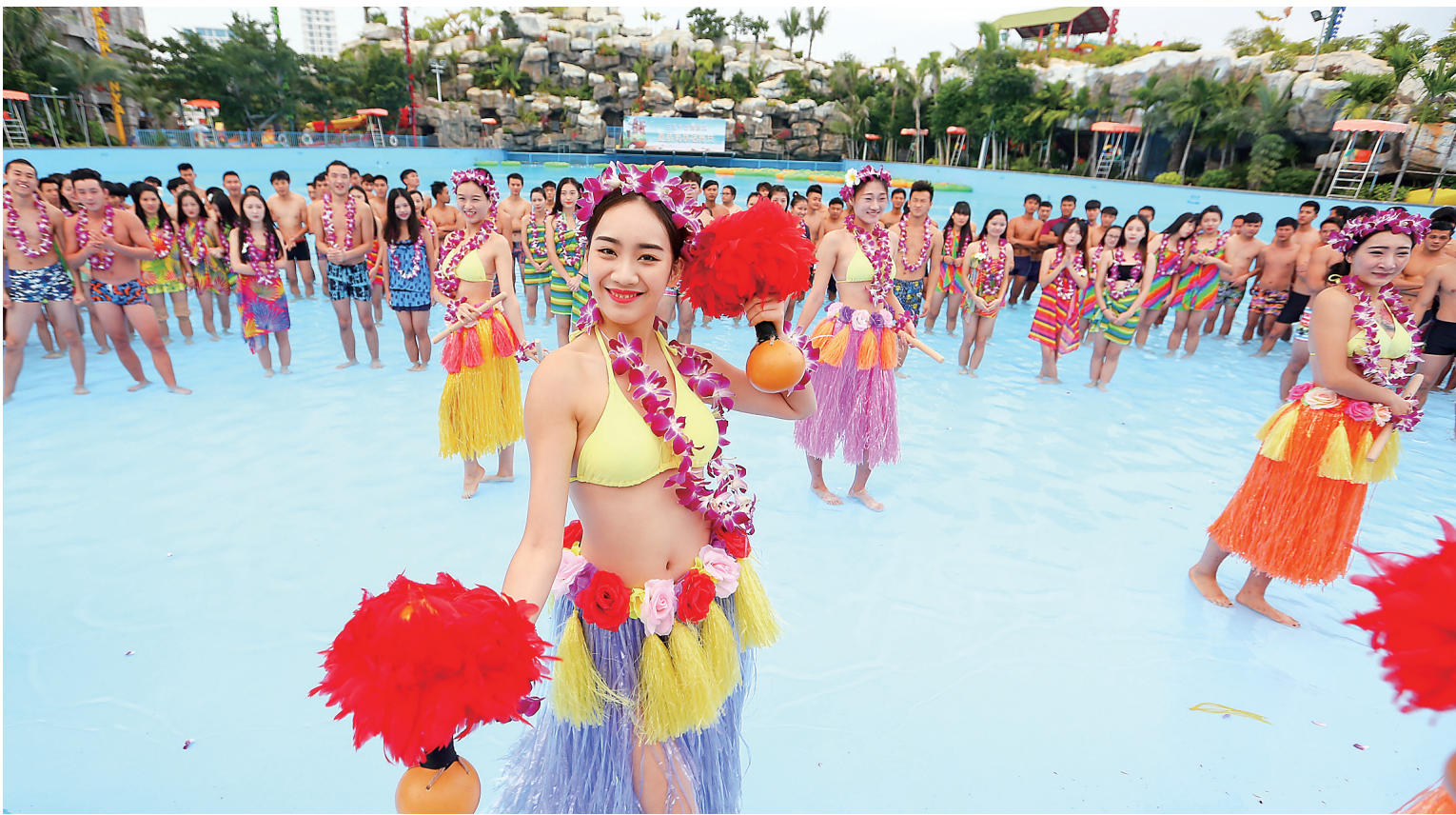
各市县多种活动迎接旅游旺季。本报记者 武威 摄

儋州积极推广“东坡文化体验之旅”精品旅游线路;琼海组织了形式多样、特色鲜明、健康文明的旅游活动,做好自驾游、乡村民俗游、亲子游等个性化旅游活动的服务工作。