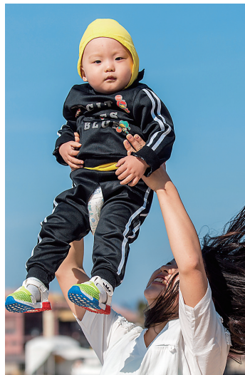
海南过大年享受冬日暖阳。

市县会展节庆活动多、景区推旅游新产品、酒店促服务提升……在即将到来的春节,海南旅游业界将以缤纷多姿、环境优化等服务游客,展现海南作为热门旅游目的地的“新春气质”。