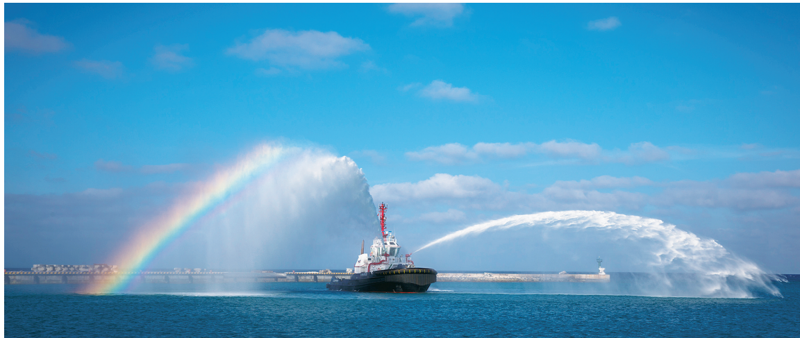
1月30日,三沙市永兴岛综合码头,“三沙综合保障船01号”在展示高压消防水炮的功能。

据介绍,该船目前仍在试航阶段,在正式投入使用后,将长期部署在三沙海域巡航。该船在协助其他船舶靠离码头,保障船舶安全的同时,可为海上失去动力的船舶提供应急拖带服务。此外,还可利用船身配备的高压水炮,为海上失火船舶提供海上消防应急救援功能,并将协助执法船只在三沙海域发挥南海维权作用。未来,该船还将发挥起岛际交通船的作用,为三沙岛礁的生活补给提供更加便利的服务。