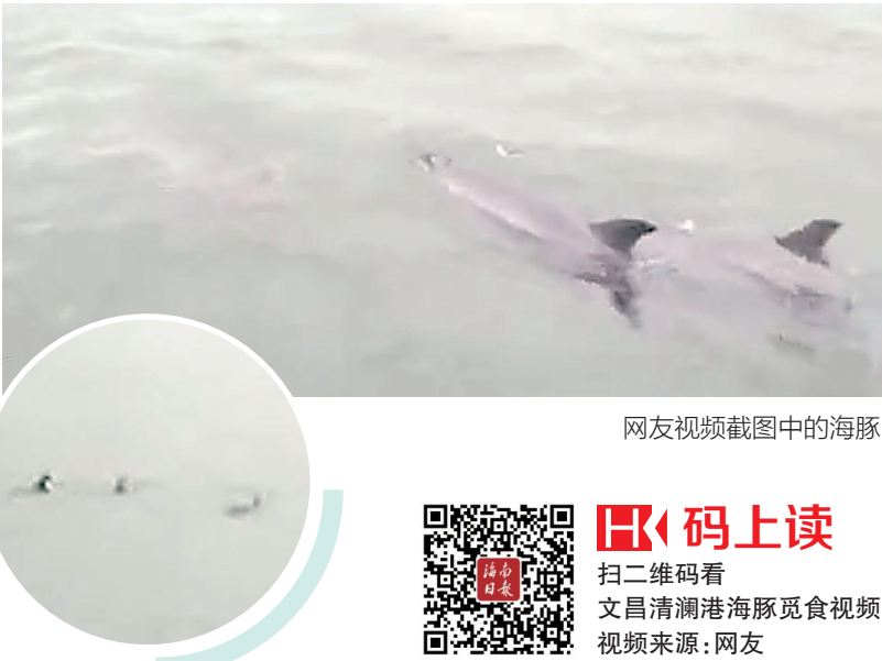
网友视频截图中的海豚

保护动物，对于海洋生态环境的要求很高。只有清澜港的海水非常干净，海洋生态保护工作做得好，它们才会成群前来觅食。” 据悉，文昌清澜港在天气晴朗的时候，进进出出的渔船有近百艘。为了做好海洋环境保护工作，文昌渔政渔港监督管理站的工作人员每天巡逻，严禁进港渔船设置渔网，为海洋生物在清澜港航道的活动提供畅通渠道；管理站还禁止渔船港内排污，避免机械油污污染港内海水，没有专业处理设备的港外排污也不被允许。 目前，文昌渔政渔港监督管理站已派出执法人员和执法艇在清澜大桥附近海域搜寻，如果能找到海豚，将引导海豚游出港口，避免受到伤害。同时，管理站也已通知所有船只注意避让，以免误伤海豚。