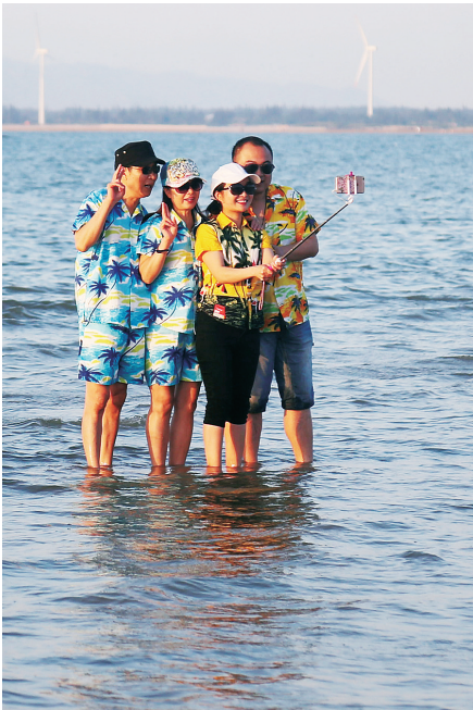
市民游客在东方海边享受春节假期。

假日期间迎来大量中短途自驾车游客,许多农户通过开发周边服务取得良好的经济效益。国家级文物保护单位孔庙和韩家宅,省级文物保护单位符家宅和宋氏祖居,历史文化名村会文十八行村、文南文城镇老街、历史文化名镇铺前骑楼老街等文化旅游景点也迎来旺盛客流。