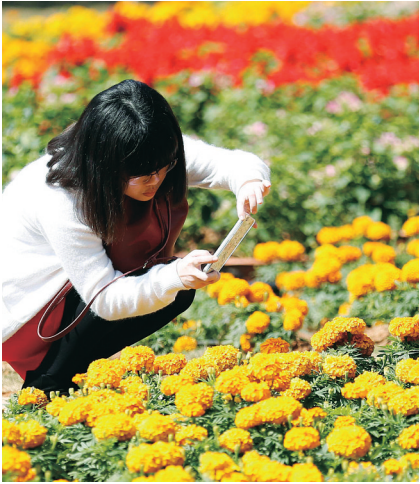
又是一年出游季。

春节黄金周期间三亚日均车流量高达38万辆,全省东西南北中各大景区、餐饮和购物点停车场泊满了来自粤、贵、川、渝、桂、京、浙、黑、湘、鲁等全国各地的车辆,各市县旅游市场一片繁荣。 同时,由于散客、自驾车游客大幅增加,各乡村旅游点热闹非凡。据统计,春节期间,全省接待乡村旅游客99.12万人次,同比增长21.6%。