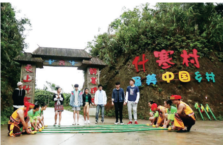
游客享海南民俗风情。

今年春节假日,各大景区、旅游区基本以自驾车游客为主,团散比达到2:8。自驾车辆主要来自海南、广东、四川、湖南、黑龙江等地,大年初一东山岭文化旅游区就迎来自驾车近5000辆,春节第二三天小高峰,奥特莱斯停车场一位难求,日月湾、神州半岛、石梅湾等旅游区自驾车辆川流不息。同时,乡村游也成为热点。1月20日,永范花海正式开园。春节期间,永范花海共计接待游客9568人次;兴隆有机咖啡园在春节期间推出手工制作体验项目新年咖啡套餐,游客在此可以体验冲泡咖啡、动手制作点心等乐趣,家庭亲子游模式其乐融融;此外,文通村、溪边村、和乐龙舟小镇、兴隆绿道等乡村旅游项目,慕名而来的游客比比皆是,游客充分感受到万宁特色的美丽乡村,感受到滨海城市的独特年味。