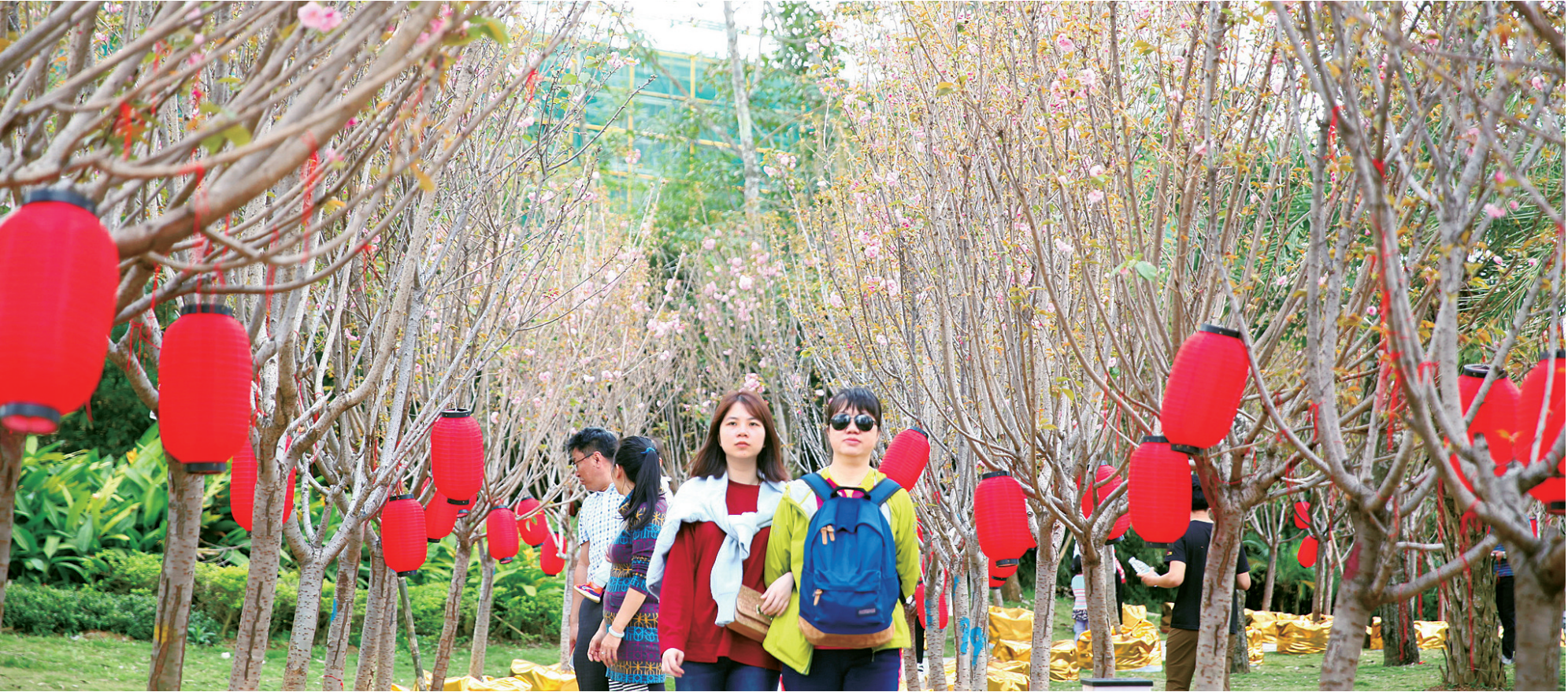
樱花绽放游人。本报记者 张茂 摄