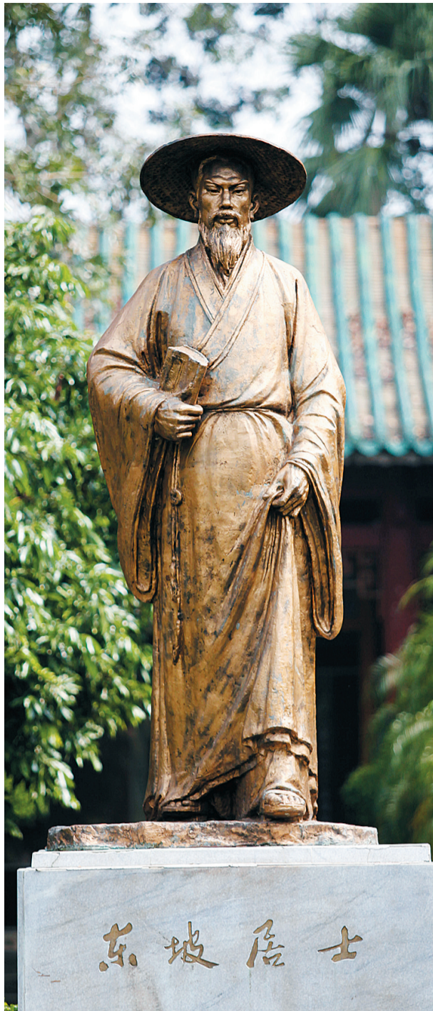
苏东坡居士塑像。

中国被称为“诗的国度”。绚烂的中华诗词对文化的积累、性情的熏陶、人格的培养乃至整个民族精神的塑造和形成都具有非常重要的作用。因此，中华民族向来十分重视诗教，很多人自小学语时就开始接触诗词。