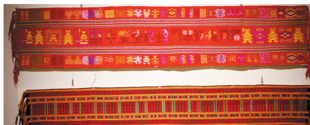
黎族杞方言十二生(下)肖织锦(上)和婚礼图