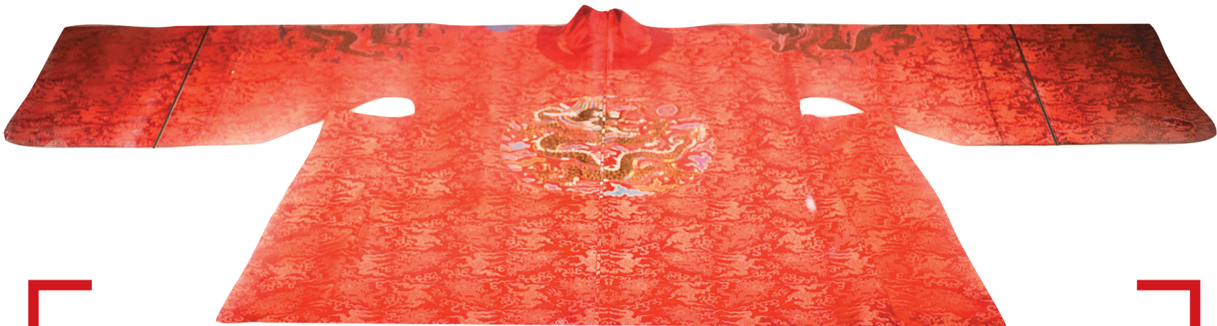
明万历帝四团龙真金孔雀羽龙袍。