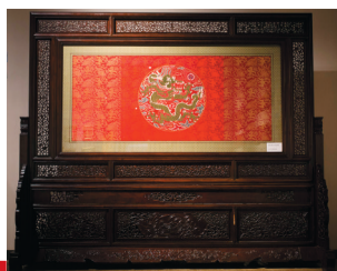
真金孔雀羽大团龙地屏。

当著名影星范冰冰身着服装设计劳伦斯·许为其量身定制的云锦“龙袍”礼服惊艳戛纳电影节红毯时,云锦也让世人再度领略了它的美不胜收。现如今,小到独具匠心的文创产品,大至巧夺天工的艺术作品,两种织锦以各种形式走近大众,焕活自身的同时,都在为中国传统文化的传承与发展贡献着一己之力。■