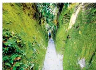
古道深谷幽幽。