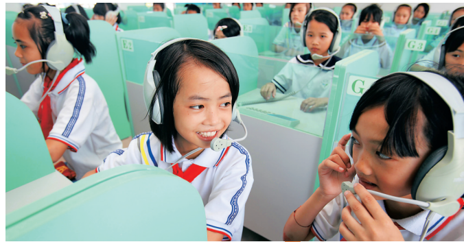
在白沙黎族自治县思源学校语音教室内，小朋友在学英语。