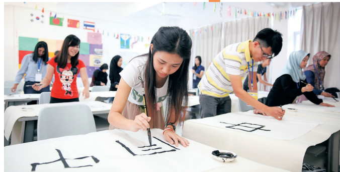
2016 年 10 月 27 日，在海南师范大学，参加“汉语桥”秋令营的马来西亚学子在用毛笔练习写汉字。