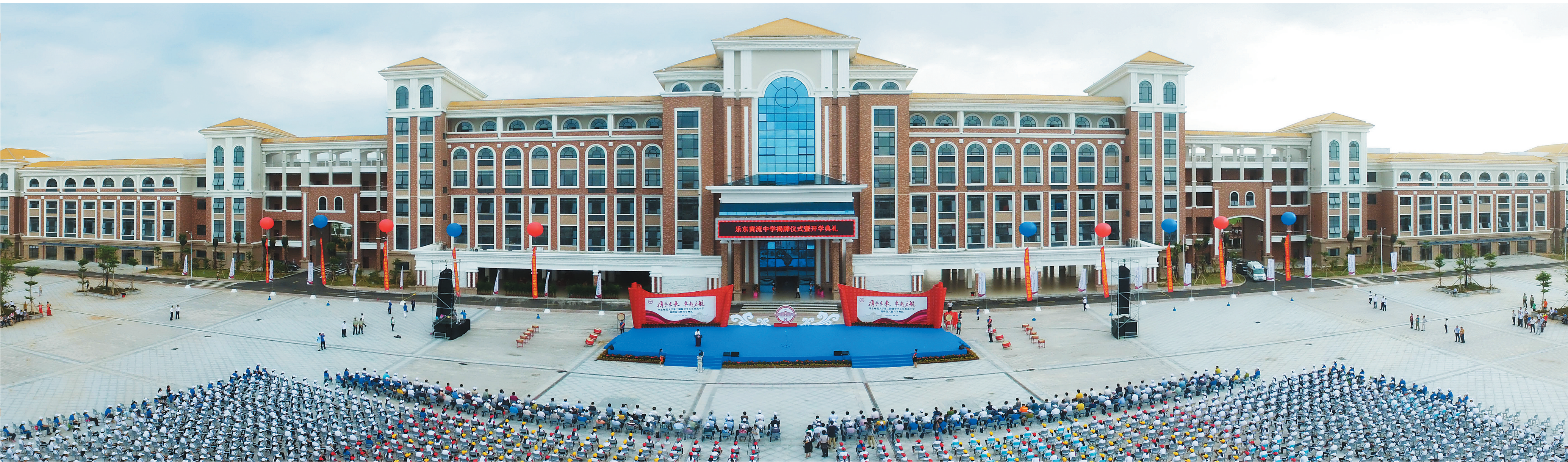
2016 年 9 月 1 日，华东师范大学第二附属中学乐东黄流中学举行揭牌仪式暨开学典礼。 本报记者 武威 摄