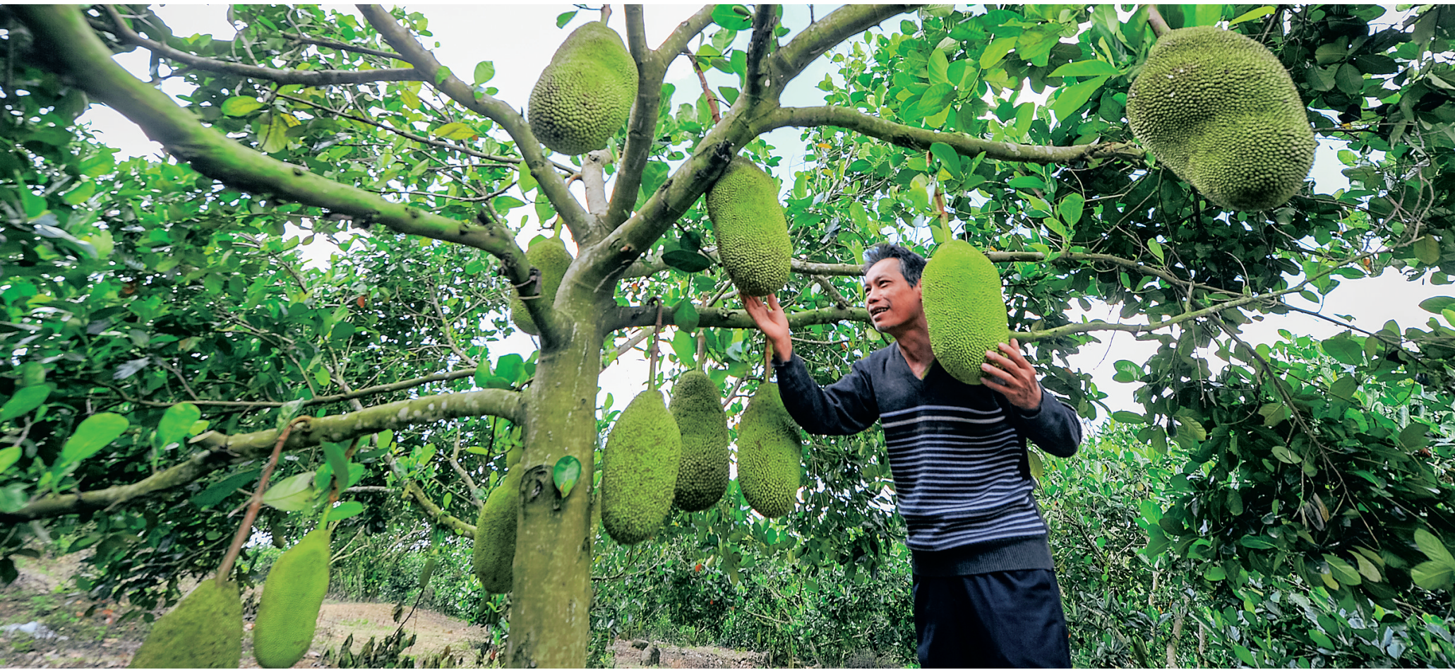
枝头硕果累累 农户喜笑颜开

“推进农场农用地清理规范管理工作，既是新一轮海南农垦改革的大事，也是维护垦区广大职工群众切身利益的好事。”海垦控股集团农场事务部相关负责人表示，一定要让垦区职工群众充分认识到，与农场签订合同，依法确立土地使用法律关系，是维护自身合法权益的重要途径，也是维护农场国有资产必须履行的义务。