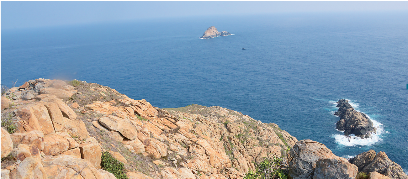
七洲列岛南峙北岸景观

“这里与海有关的景观，包括海岛、海滩、海浪、海鸟、海蚀地貌、海滨植被等等，应有尽有，蔚为壮观，被誉为海南岛东北近岸最美的海岛。”文昌籍科学家、中科院华南植物园首席研究员邢福武曾登上七洲列岛考察，对这里的美景大加赞赏。为此，他曾经广泛阅读相关历史书籍，考察了七洲列岛的历史渊源。那么，历史上的七洲列岛，究竟是怎样一个形貌呢？