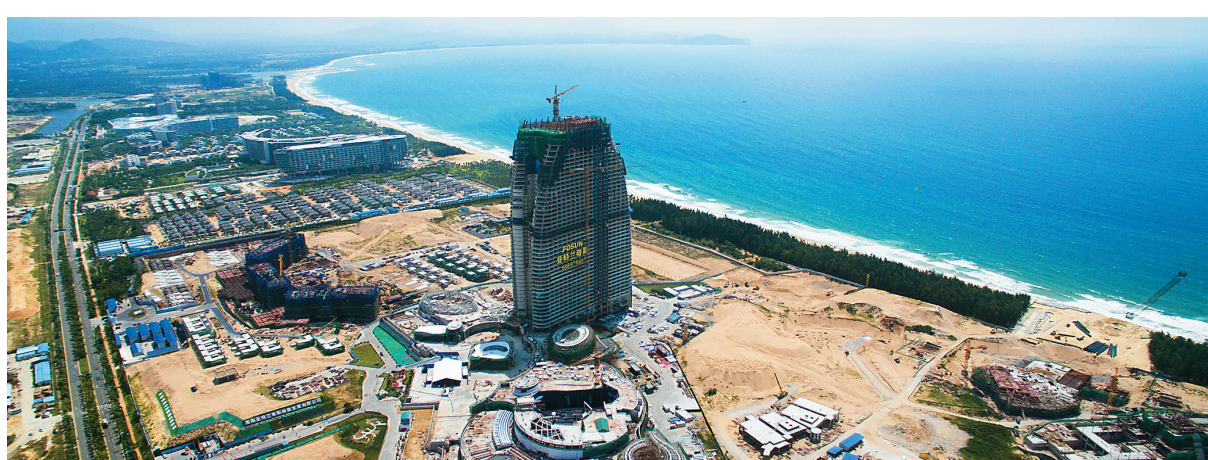
亚特兰蒂斯项目将为三亚旅游业注入新动力。

发展农业专业合作社40家,农产品省级著名商标达到15个,全市农业总产值105亿元,增长4.0%。 金融产业继续壮大,增速位居各行业之首。其中兴业银行三亚分行正式开业,海南银行三亚分行、浦发银行三亚分行获批准筹建,全年金融业增加值57亿元,增长15.5%。 根据三亚东精西拓、南优北进的城市产业布局,三亚决定将崖州湾打造成为三亚新的经济增长极,发展新兴科技产业,并主力承载三亚面向南海、服务南海的海洋强市梦。为此,