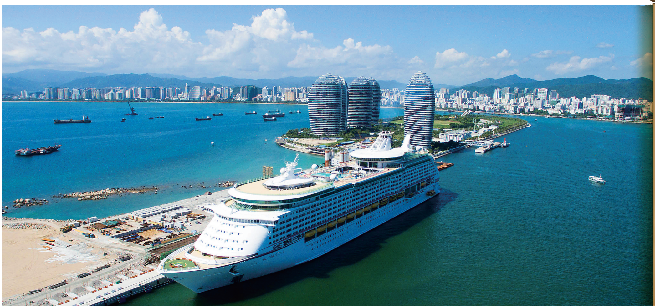
近年来,三亚邮轮产业发展稳健,凤凰岛国际邮轮港每年都接待不少世界各地的邮轮靠泊。

如果说修复山、海、河生态环境,是在为三亚经济发展打造好投资软环境,那么重点项目建设,则是城市实体经济发展的关键动力,是调优产业结构的重要载体,更是民生保障与改善的重要支撑。