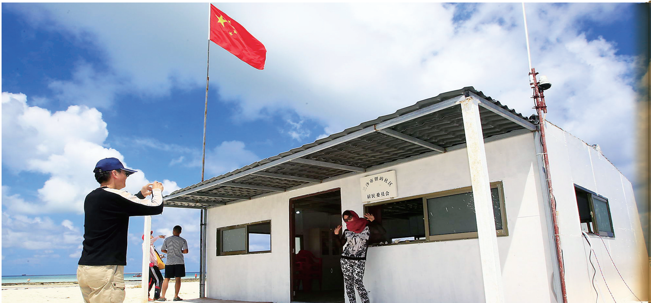
游客在三沙市银屿社区居民委员会前合影留念。

“升国旗,奏国歌!”每个周一的清晨,当太阳照耀在200多万平方公里海域上时,三沙市各岛礁开始了升国旗仪式。各行各业的人们汇聚在旗杆下,高唱国歌,仰望五星红旗飘扬,心中充满了力量。