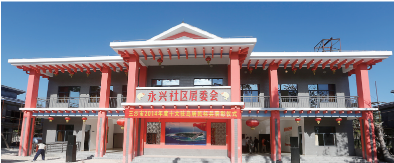
永兴社区居委会办公楼。