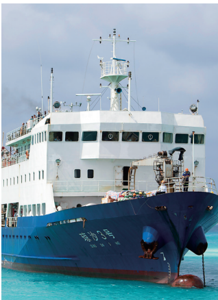
“琼沙3号”补给船。