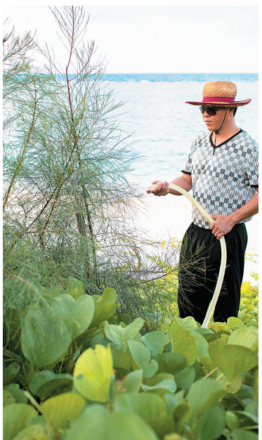
北岛上的草海桐、木麻黄和马鞍藤长势喜人。