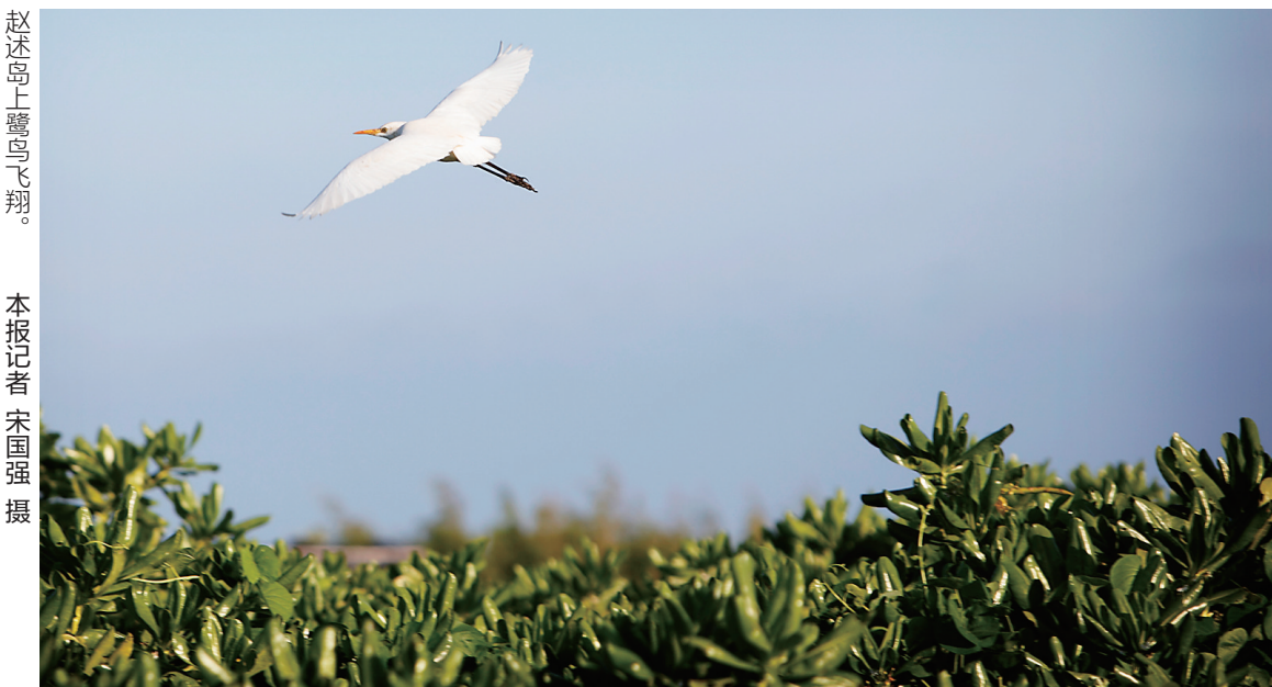
赵述岛上鹭鸟飞翔。

和签订合同,完成三沙市南海金枪鱼资源开发项目和西沙群岛活体砵礁资源调查项目的经费预算报告编制,并以此为基础,确定作业渔场的容量和捕捞量,科学合理制定限额捕捞制度。