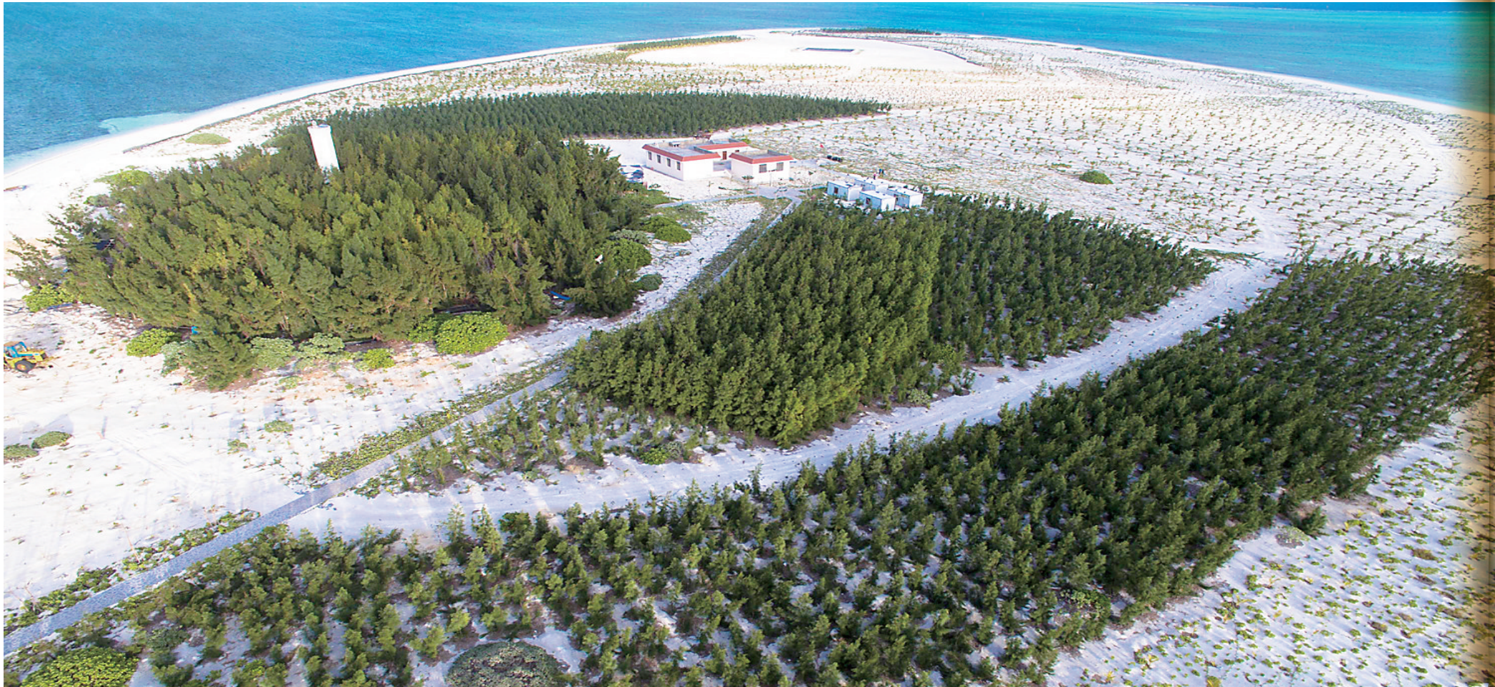
三沙市西沙洲如今绿意葱茏。

晋卿岛和石屿中的一汪深蓝,在阳光的照耀下晕染出不同的色泽,宛如镶嵌于碧波之上的蓝宝石,粼粼波光之下掩藏着大自然无穷的奥秘——这里是世界上最深的海洋蓝洞“三沙永乐龙洞”,被外界称为“南海之眼”,这里更是三沙市长期坚持生态环境保护的见证。