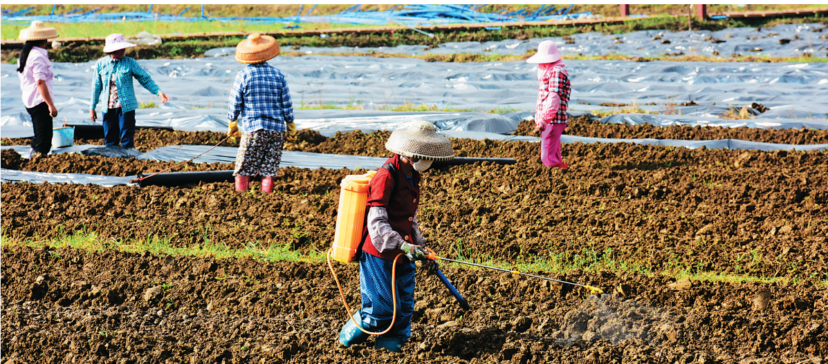
琼海市嘉积镇龙寿村花海为许多贫困户提供就业岗位。