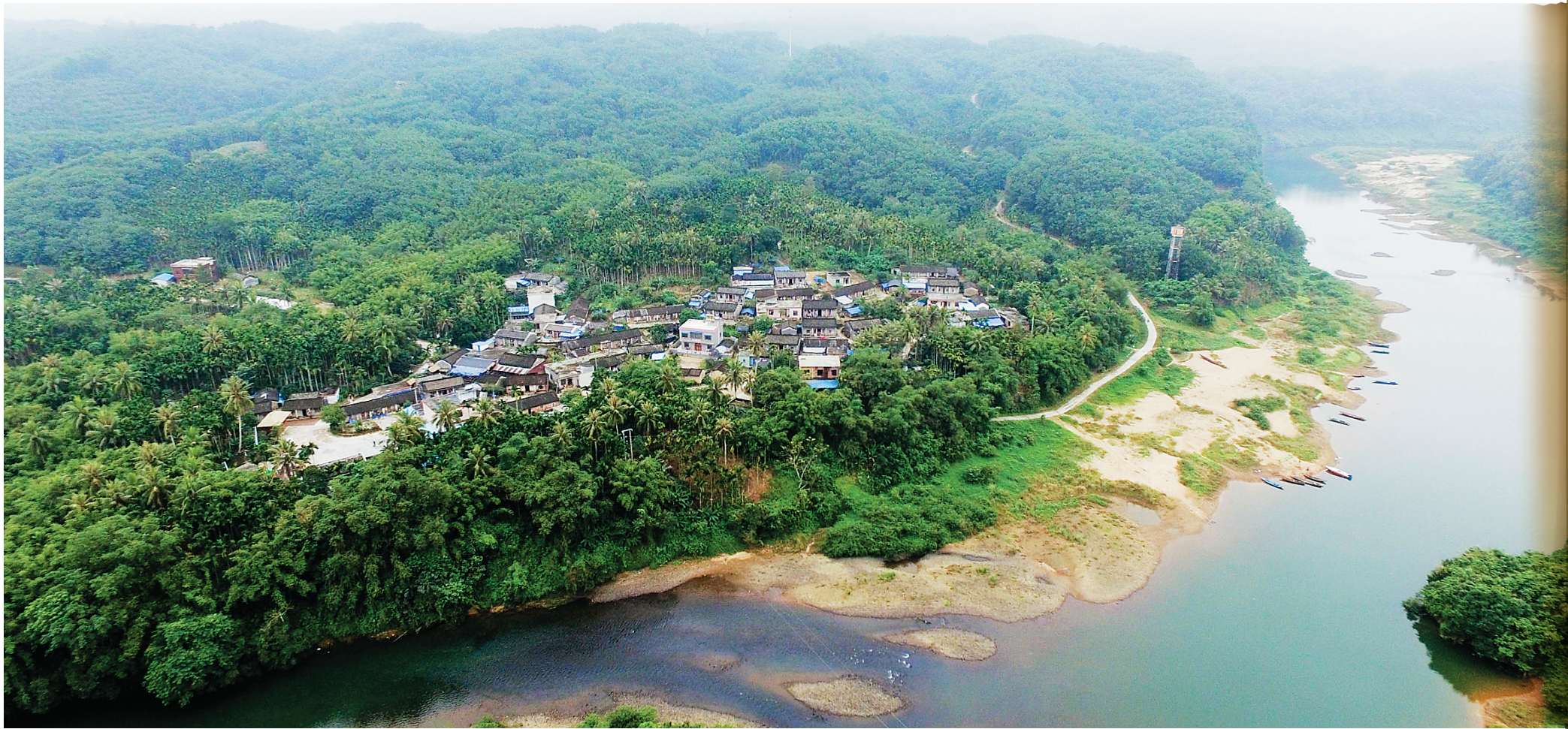
琼海市政府发挥旅游资源优势,将会山镇加脑村从“脏乱差”的苗村变身成为洁净优美的特色苗寨。

2016年,通过靶向发力,多渠道、多元化的精准扶贫,琼海市取得了脱贫攻坚战的良好成果:全市所有农村贫困人口基本实现全面脱贫,整村推进的5个贫困村实现区域性整体脱贫,全市贫困家庭人均收入全部超过国家脱贫底线2965元,全面实现“不愁吃、不愁穿,义务教育、医疗保障、住房安全三保障”目标。在全省精准扶贫成效第三方评估中,琼海名列前茅。