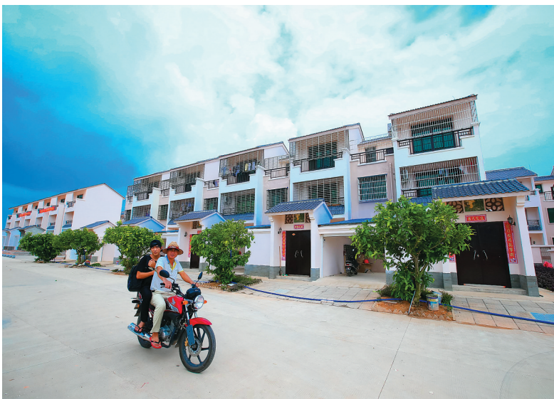
文昌铜鼓岭淇水安置区整洁靓丽。

2016年,文昌还严格落实安全生产责任制,有效应对“莎莉嘉”强台风、强降雨等自然灾害,及时转移安置群众,最大限度保障群众生命财产安全。(本报文城2月19日电)