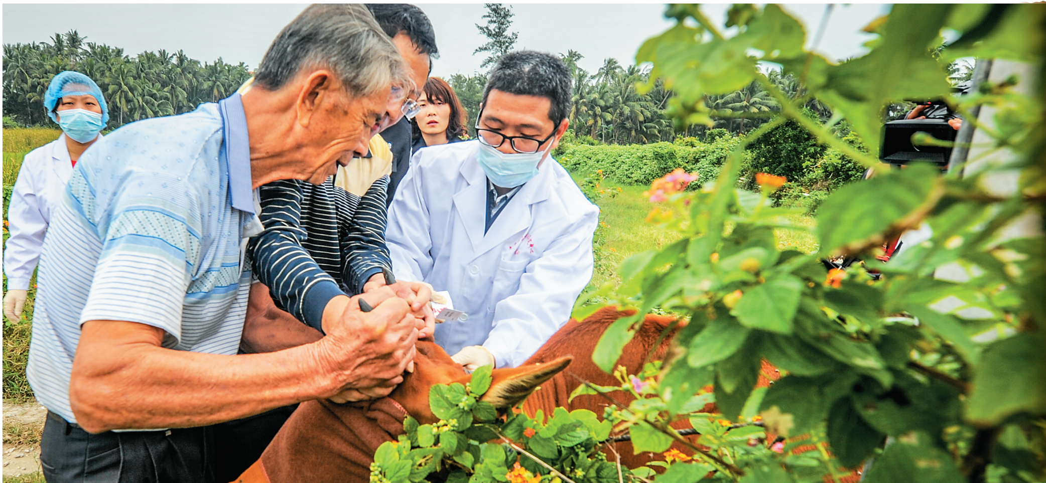
公安部门技术人员为贫困户的牛采集DNA并录入数据库,以利精准打击盗窃牲畜犯罪,维护贫困户利益。

在“十三五”开局之年,文昌把“精准”贯穿到脱贫攻坚工作全过程,紧盯脱贫收入标准,按照“两不愁三保障”要求,着力实施“一户一策、一户一法”,强力推进中央“五个一批”、省“十项扶贫政策”和市“六项帮扶政策”。从扶贫工作部署,到扶贫工作展开,再扶贫到工作投入,文昌这一年打出了一整套脱贫攻坚“组合拳”,精准扶贫、精准脱贫取得了阶段性成效。