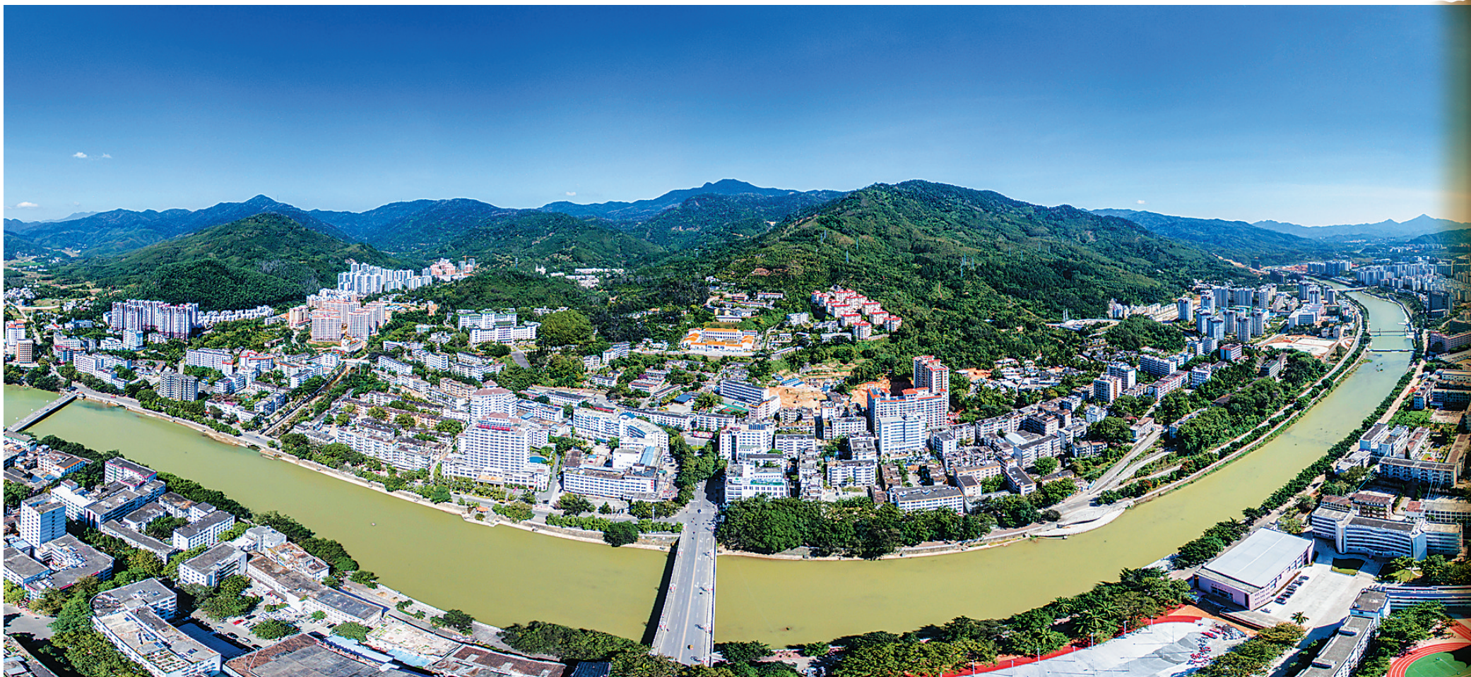
五指山市境内森林覆盖率高达86%,有“天然别墅”和“翡翠山城”之称。

徜徉在群山环抱间,美丽的翡翠城五指山市正迎着“十三五”阔步向前,迈出发展新姿态。刚刚过去的2016年,五指山市攻坚克难,经济发展保持平稳,各项事业全面进步,社会大局和谐稳定,人民群众安居乐业,较好完成了既定的目标任务,实现了“十三五”良好开局。