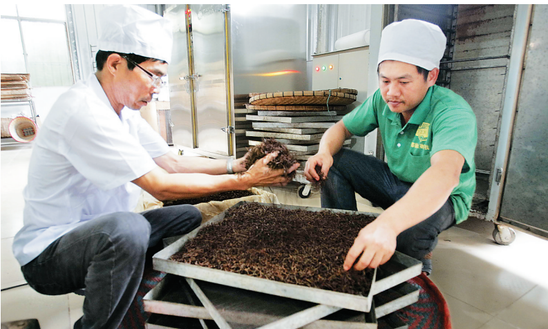
水满乡永训茶基地,工人正在加工茶叶。 本报记者 武威 摄

“十三五”期间,该市将大力发展热带山地高效农业,全面实施特色农产品区域品牌发展战略,鼓励和支持农业企业、专业合作社注册产品商标,集中力量做精做强一批五指山特色农