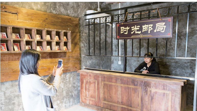
陵水文罗镇坡村发展特色旅游,游客在时光邮局留影。

今年,陵水将重点推进南繁基地农田水利设施项目、中南部水系连通工程,计划完成县城南北片区干道升级改造沥青路面铺设工程、吊罗山国家森林公园旅游公路项目;推进环岛滨海旅游公路陵水段项目、都总坝扩建工程、县城中心大道市政道路改扩建工程等,持续完善基础设施建设。