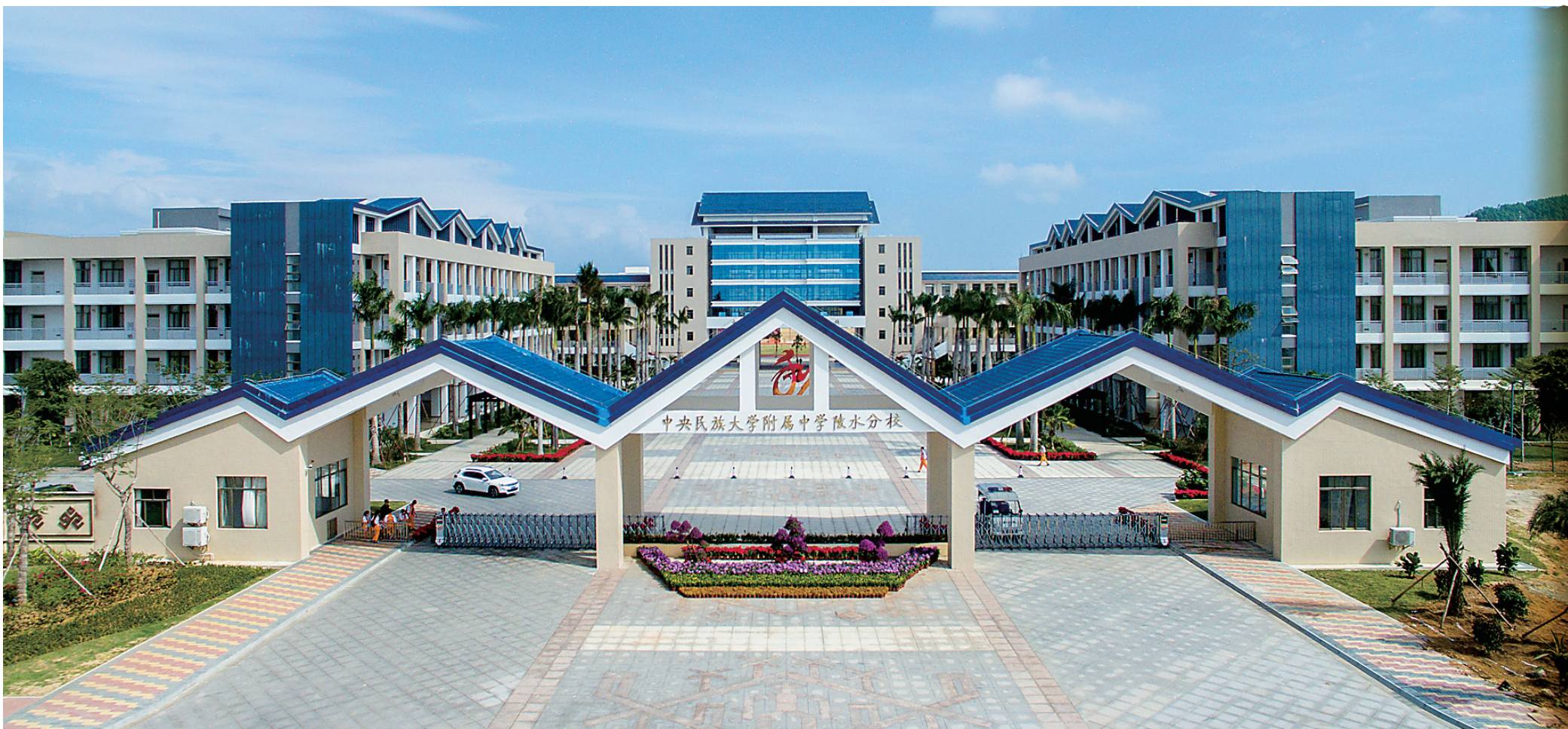
中央民族大学附属中学陵水分校。

谋民生之利,解民生之忧。“十三五”开局,陵水黎族自治县在扶贫、教育、医疗卫生、基础设施建设等领域不断突破,将群众最关心、最直接、最现实的问题摆在各项工作的首要位置,提高群众生活水平。珍珠海岸,随处可见百姓带着幸福的微笑。