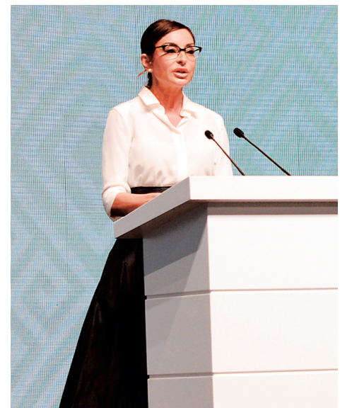
阿塞拜疆总统伊利哈姆·阿利耶夫(上图,新华社发)为其第一副总统。

去年9月,阿塞拜疆全民公决通过宪法修正案。该修正案将一届总统任期由5年延长至7年,并提出设立两名副总统,第一副总统为国家二号领导人。根据新宪法,总统负责任免两名副总统,一旦总统在任期内无法履职,第一副总统将代为行使总统职权。