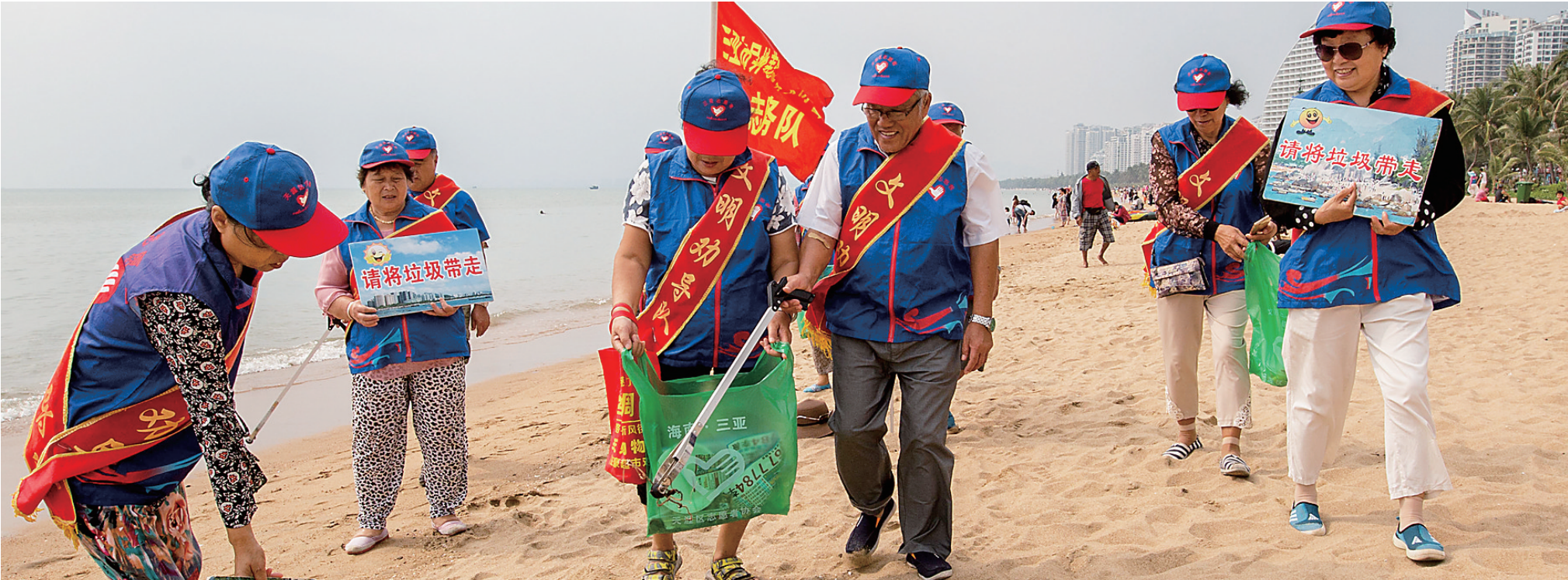
3月2日，三亚市异地养老老年人协会的志愿者们穿着蓝色马甲，手持宣传牌，在三亚湾沙滩上对不文明行为进行劝导，同时清理沙滩上的垃圾。