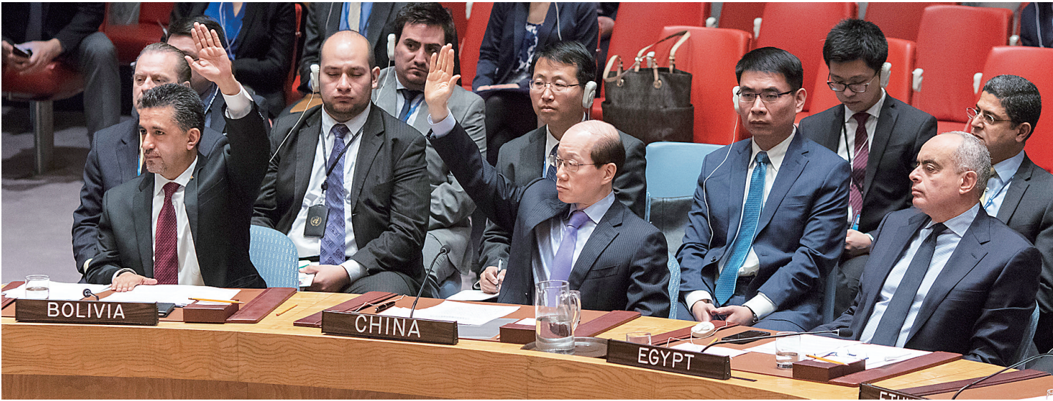
在位于纽约的联合国总部，中国常驻联合国代表刘结一（前排中）在安理会就有关叙利亚化学武器问题决议草案进行表决时投反对票。

连日来，中国常驻联合国代表刘结一脱稿回击英美日“围攻”的视频火了，有关画面在“朋友圈”中刷屏。 事情的原委大致是这样的。联合国安理会2月28日就有关叙利亚化学武器问题的决议草案举行表决，中国与俄罗斯都行使了否决权，草案未获通过。这并不是中国第一次就涉叙决议草案投否决票，因而当时并未引起民众广泛关注。但随着刘结一大使的“超长发言”通过联合国官网公布后，其有理有据有节的回应连日来赢得了网民们的点赞，“好样的”“厉害了，我的国”之类的留言不断。 点赞是因为，中国坚持原则，不委曲求全，该出手时就出手，不做国际外交舞台上的老好人，中国外交官们的风采得到广泛认可。 拿此次安理会投票来说，对在叙利亚境内使用化学材料作为武器问题的调查仍在进行之中，且在安理会成员国之间存在严重分歧，英法美等就推动强行付诸表决。很明显，此举无助于解决叙利亚化武问题，无助于推进