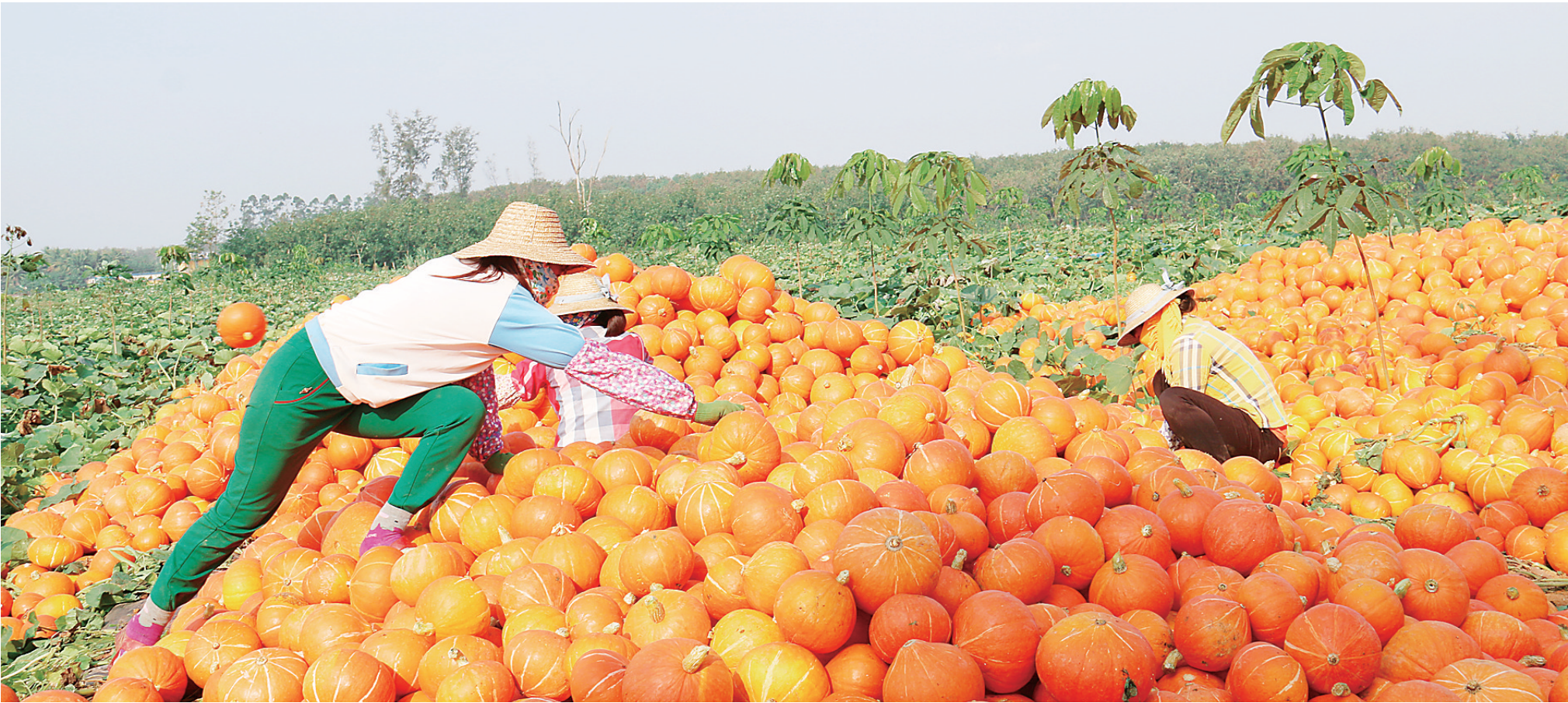
龙江分公司长龙四十一队金南瓜丰收的场景。

本报牙叉3月5日电(记者孙慧 通讯员李林娟 何兴辉)记者今天从海南农垦橡胶集团龙江分公司获知,龙江分公司发展林下种植,在橡胶小苗间种植金南瓜1800亩,实现大丰收,共收获金南瓜540万斤。