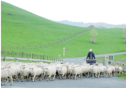
新西兰北岛牧羊人。