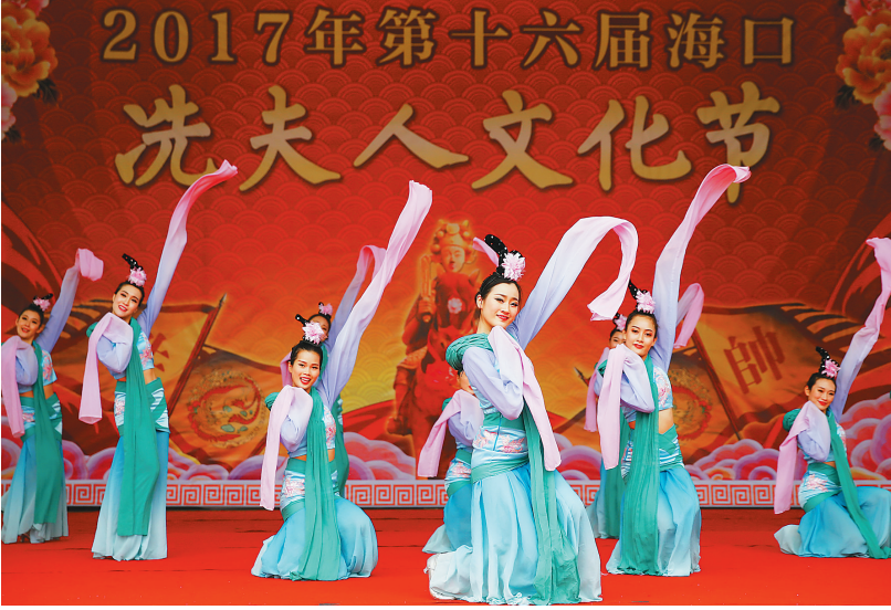
3月6日,在海口市龙华区新坡镇,第十六届海口洗夫人文化节开幕式表演。

据活动组委会相关负责人介绍,本次洗夫人文化节积极探索民俗文化 with 乡村旅游的融合发展,增加了千人军坡宴、洗夫人民俗文化一日游等活动,并开通了骑楼老街至洗夫人文化节活动现场的穿梭巴士,方便游客参与。接下来还将不定期组织洗夫人民俗文化一日游等活动,让来到海口旅游的外地游客能更多地了解传统民俗活动,推动全域旅游发展。