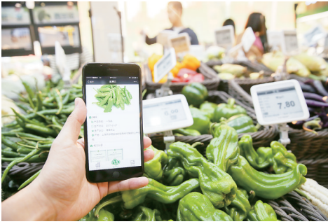
沪“智慧”菜场可“扫码”溯源

国家外汇管理局有关负责人表示，2月份我国跨境资金流动整体比较平衡，国际金融市场非美元货币对美元汇率总体贬值，但资产价格出现上升，外汇储备所投资的货币和资产之间发挥了此消彼长的分散化效应，这些因素综合作用，外汇储备规模稳中有升。