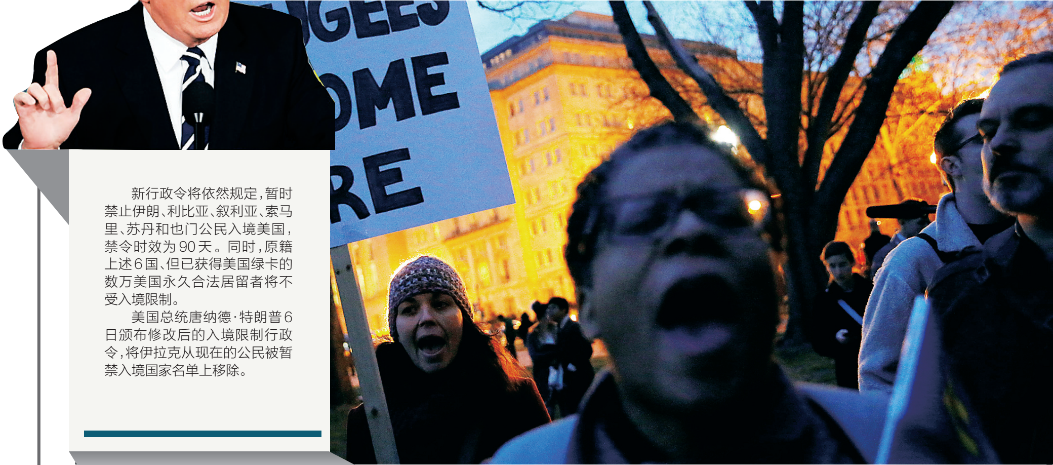
三月六日，在美国首都华盛顿，人们在白宫附近抗议移民限令。

新华社马尼拉3月7日电(记者杨柯 董成文)菲律宾众议院7日三读表决通过恢复死刑法案。根据该法案，菲律宾将对包括毒品走私在内的8类涉毒犯罪施以死刑或终身监禁。 众议院当天以216票支持、54票反对、1票弃权的表决结果通过法案。法案将提交参议院讨论表决，并由总统签署后正式生效。 原法案中，规定可对21种“严重犯罪”处以死刑。众议院上周在二读审议过程中将叛国、强奸、绑架及盗窃等严重罪行从死刑名单中排除，而仅保留对涉毒犯罪判死刑的规定。 1987年版菲律宾宪法一度废除死刑，但是允许国会在“严重犯罪”出现时恢复死刑。菲律宾国会曾于1993年治安形势恶化时恢复死刑，但是到2006年再度废除死刑。 自去年6月出任总统以来，杜特尔特重拳打击毒品等有关犯罪，力促国会恢复死刑制度。