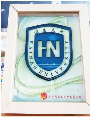
“海大小笨笨”协会成员设计的《海南大学校徽》。

此后衍纸技艺流入民间之后,表达方式更加多元化。此外,衍纸艺术的材料购买方便,价格低廉,平常百姓也能消费得起。