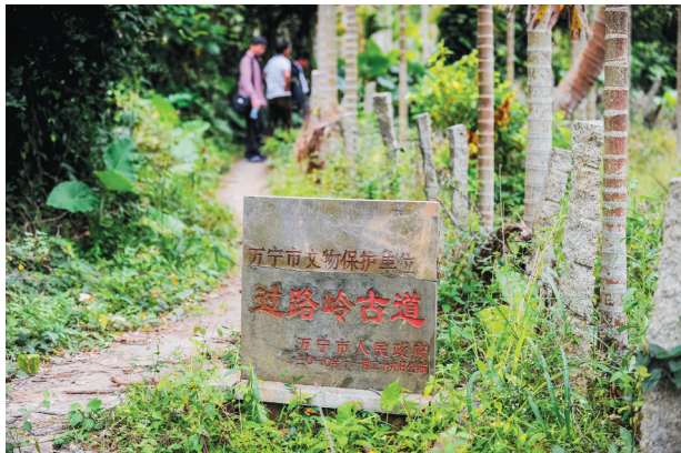
万宁过路岭古道牌子。