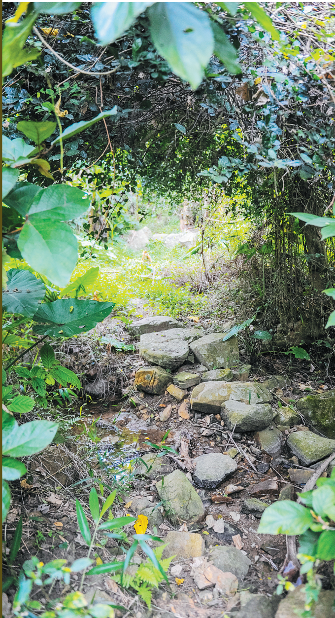
古道旁仍有细细流水。

古道,它们曾经是通商必经之道,如今多数已杂草丛生,鲜有人知。竖立的石碑,像古道的“身份证”,幽幽地讲述着昔日的“繁盛年华”。