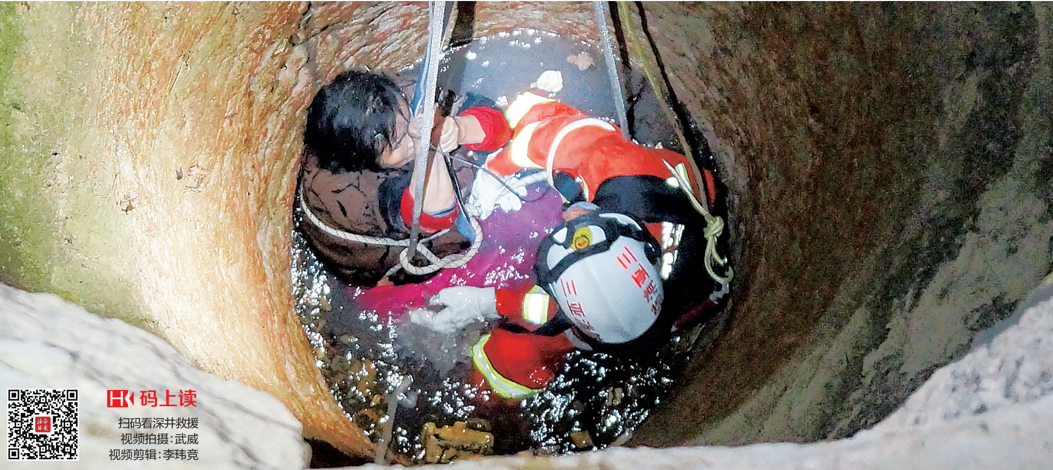
3月15日凌晨，三亚消防官兵下入井内，利用绳索救出被困妇女。