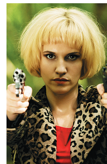
爱尔兰电影《追击》剧照

据悉，该片虽然于2015年9月便爱尔兰首映，但引进中国亦算新作品，内地影迷除了部分上海观众去年6月份在上海国际电影节期间欣赏过，其他各地影迷都是最新看到，片中的男女演员也算新面孔。