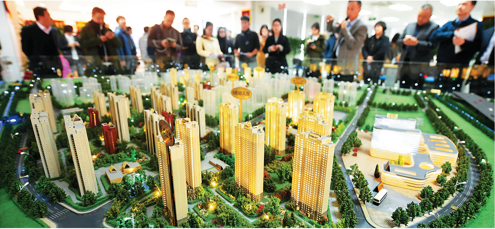
图为北京一楼盘模型。

新华社北京3月17日电(记者孔祥鑫)17日,北京市住房和城乡建设委员会、中国人民银行营业管理部、中国银行业监督管理委员会北京监管局、北京住房公积金管理中心四部门联合发布《关于完善商品住房销售和差别化信贷政策的通知》。根据通知要求,北京楼市调控再度升级,实施“认房又认贷”,还通过“一提一降”