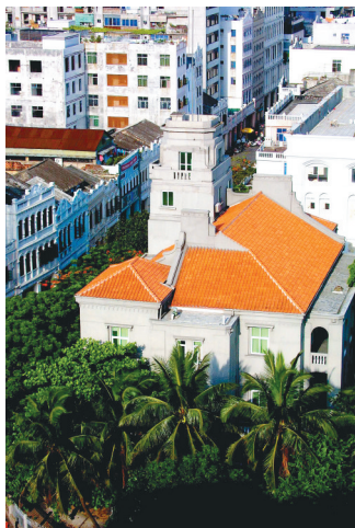
海口海关得胜沙老街老办公楼。

打开一张海口海关旧址大楼刚刚建好时的照片,那时,建筑周围还是光秃秃的,这栋楼就是一个“坐标”高点。海关对于一座城市,特别是沿海城市来说本身就是一段宝贵的历史记忆,可谓公职机构中的“老字号”。