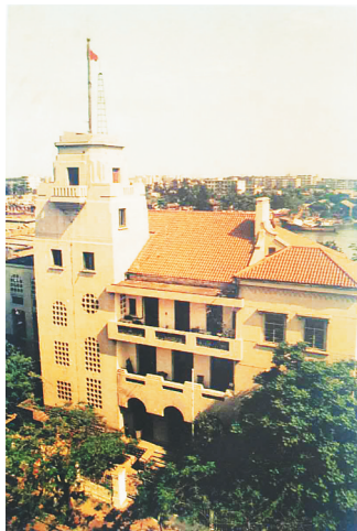
海口海关大楼,1990年代前开口在得胜沙路一侧。