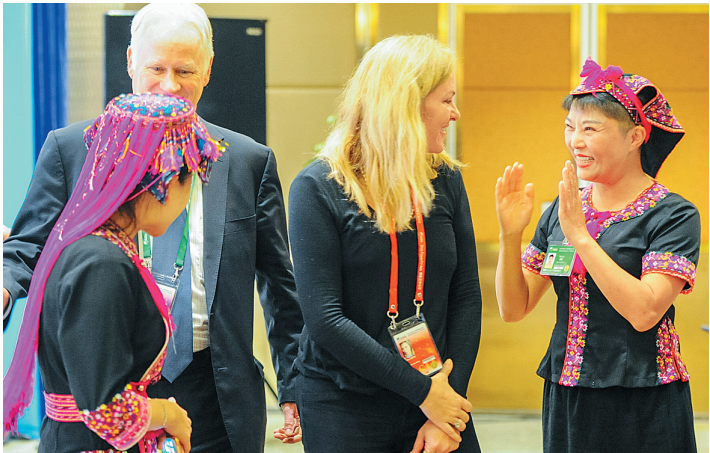
嘉宾和身着少数民族服装的工作人员交流。

3月23日，博鳌亚洲论坛2017年年会现场，智能机器人、VR体验等高科技产品纷纷亮相，而海南本土特色的美食及民族风也成为现场一道道亮丽风景线。