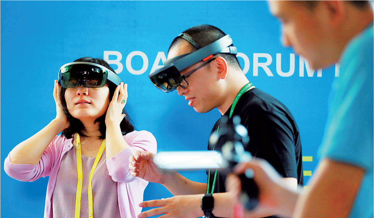
VR设备让与会者全方位感受科技带来的变化。

中国财富传媒集团董事长葛玮表示，亚洲媒体合作组织要学会运用开放、共享、合作的互联网思维来打造亚洲媒体平台和进行“一带一路”各个国家媒体的合作。“虽然每个国家的媒体都是区域性的媒体，但是通过网络的组带联动到一起，就可以形成一个覆盖很多国家的媒体联盟，在这样一个平台上有很多方面可以共同合作。”（本报博鳌3月23日电）