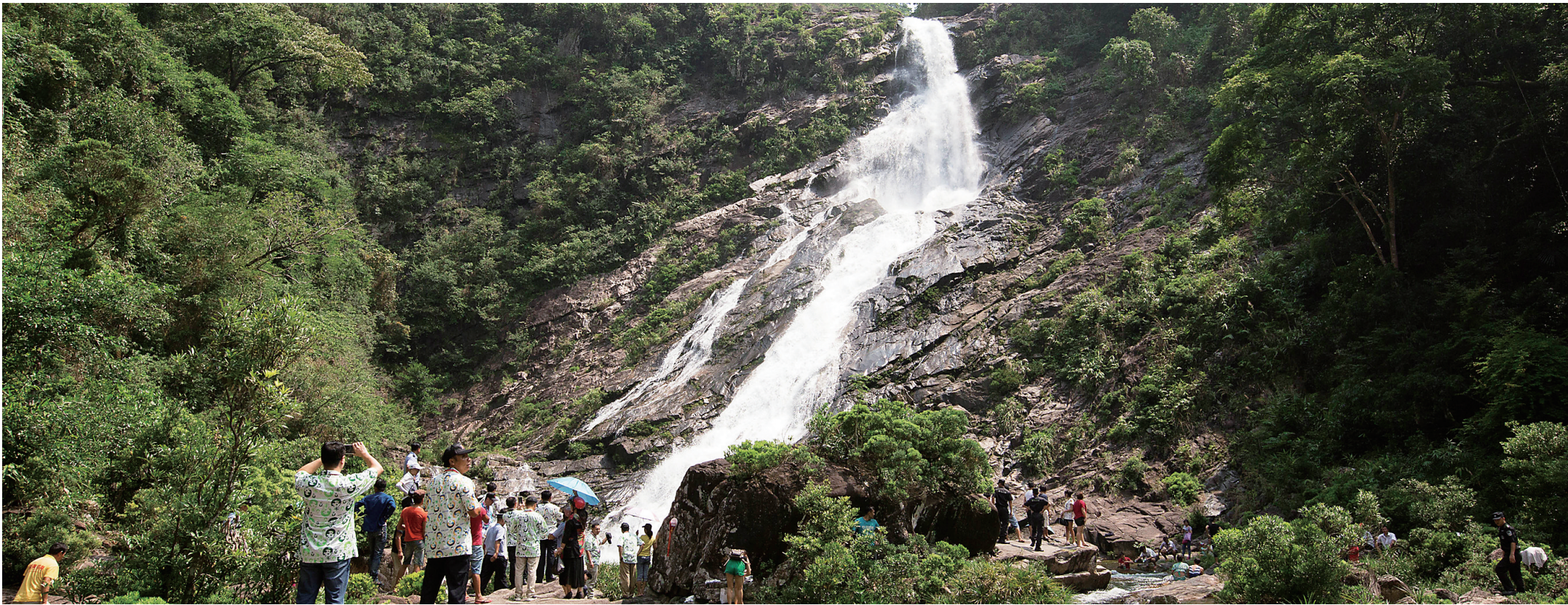
游客在陵水本号镇大里山区大里瀑布游玩。