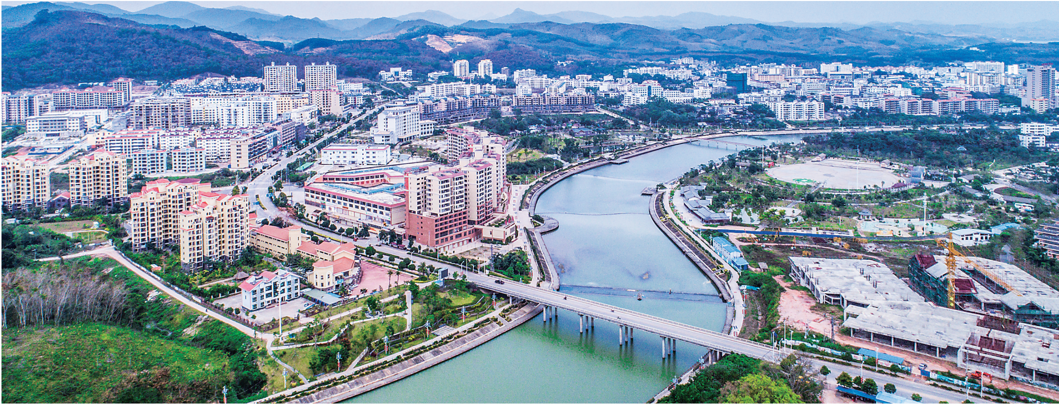
美丽白沙山清水秀。