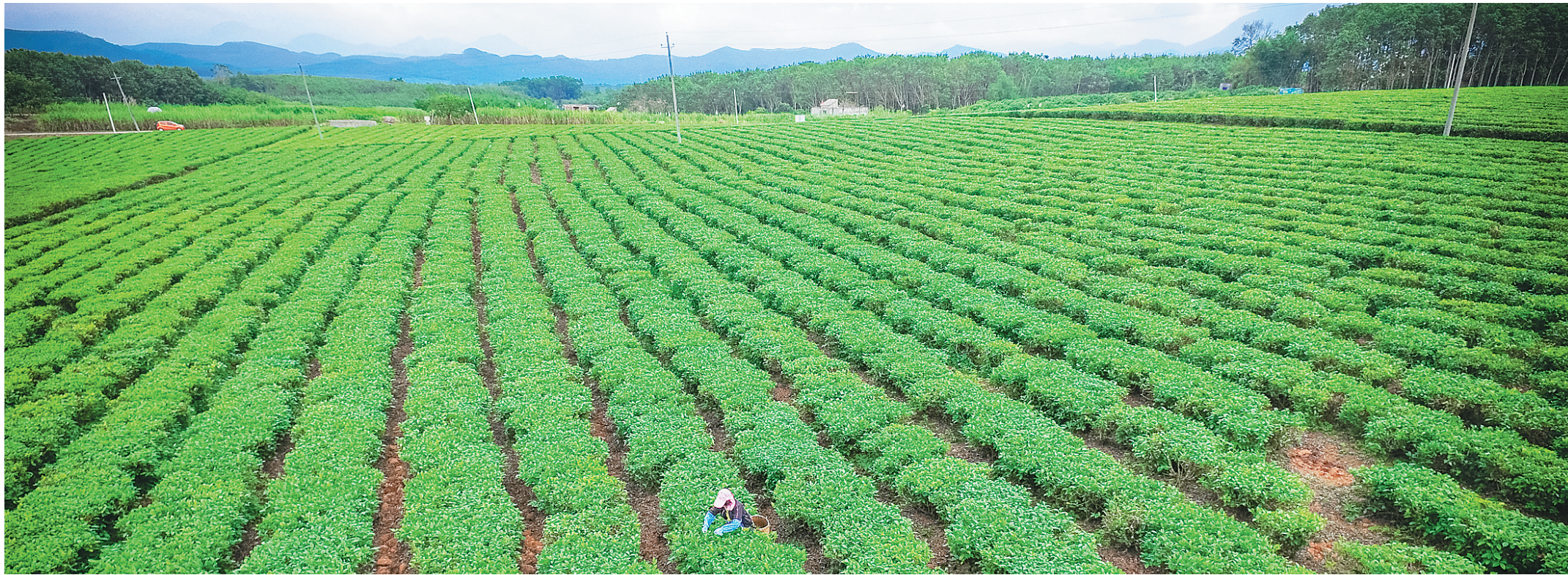
海南茶业集团白沙绿茶生产基地,农户在茶园里采茶。