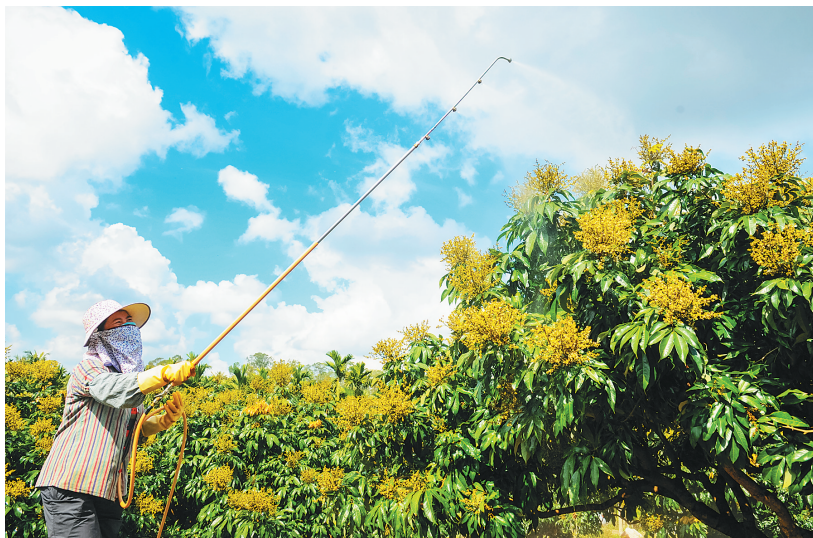
东升农场大力引导职工发展特色高效农业,调整产业结构,促进产业转型升级。图为职工在荔枝园劳作。