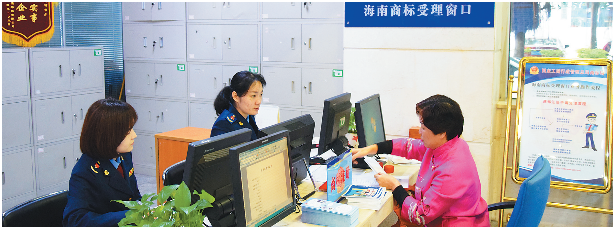
三月一日,海南商标受理窗口正式启动。