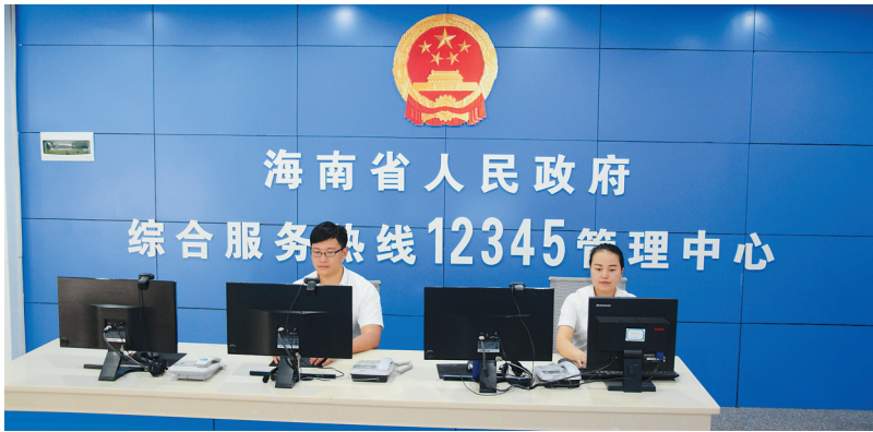
“12345”省政府综合服务热线工作人员正在汇总群众来电。本报记者 宗兆宣 通讯员 符发 摄