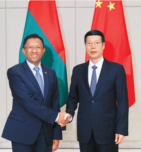
3月24日，中共中央政治局常委、国务院副总理张高丽在海南博鳌会见马达加斯加总统埃里。