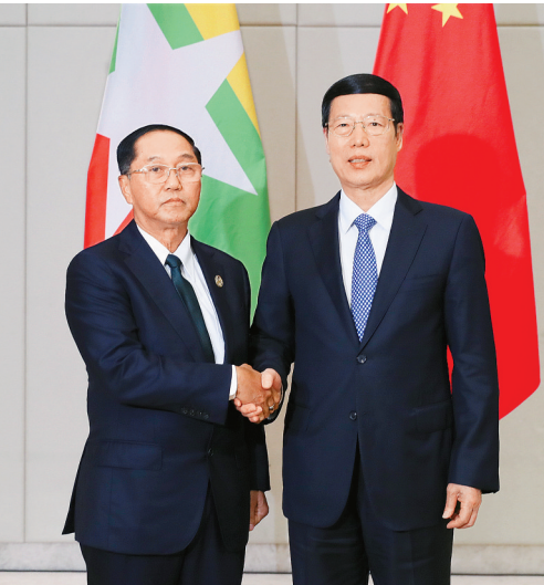
3月24日，中共中央政治局常委、国务院副总理张高丽在海南博鳌会见缅甸副总理吴敏瑞。