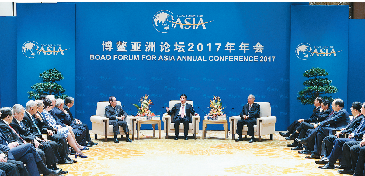
3月24日，中共中央政治局常委、国务院副总理张高丽在海南博鳌会见博鳌亚洲论坛理事长福田康夫、副理事长曾培炎和理事会部分成员。