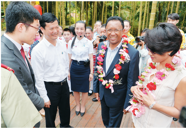
三月二十四日，马达加斯加总统埃里及夫人到琼海北仍村参观考察。