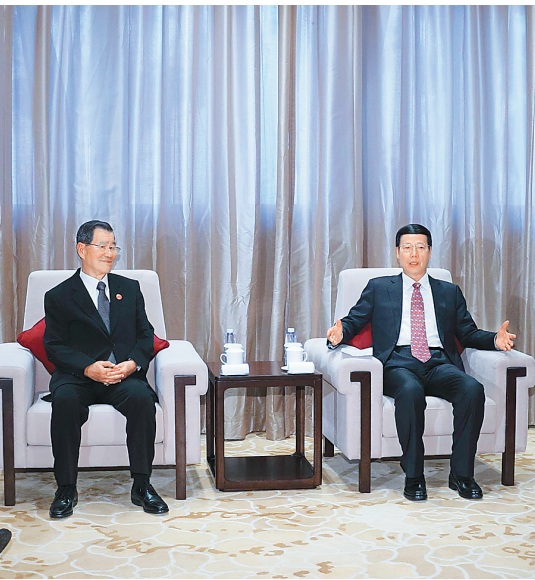
3月24日，中共中央政治局常委、国务院副总理张高丽在海南博鳌会见出席博鳌亚洲论坛2017年年会的台湾两岸共同市场基金会荣誉董事长萧万长一行。