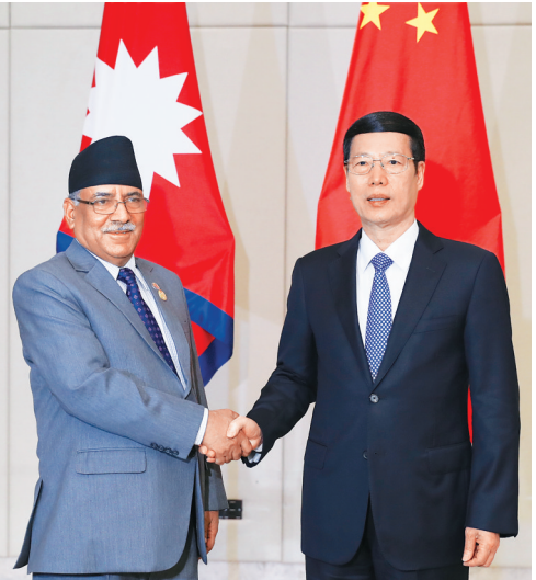
3月24日，中共中央政治局常委、国务院副总理张高丽在海南博鳌会见尼泊尔总理普拉昌达。