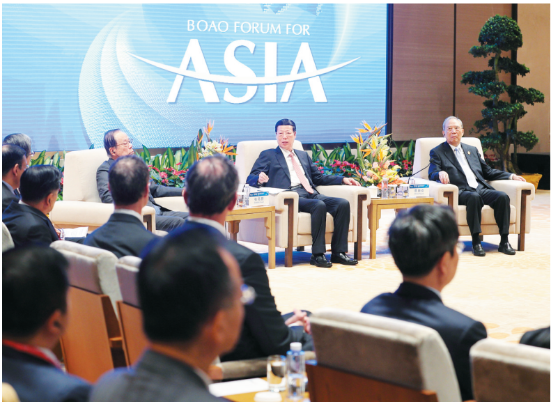
3月24日，中共中央政治局常委、国务院副总理张高丽在海南博鳌同出席博鳌亚洲论坛2017年年会的中外企业家代表座谈。