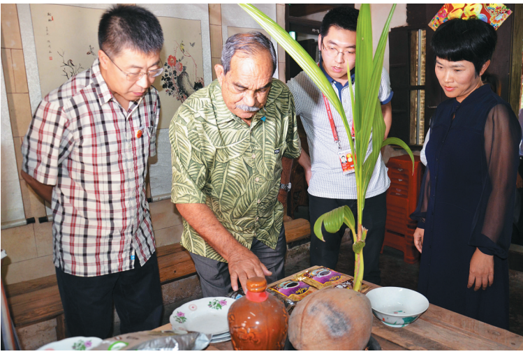
三月二十四日，密克罗尼西亚联邦总统彼得·克里斯琴到琼海北仍村参观考察。