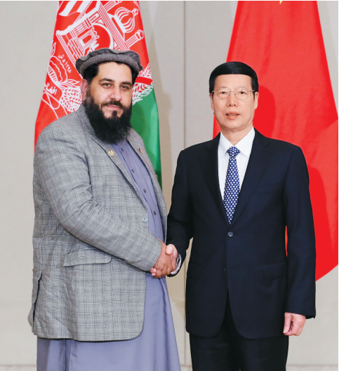
3月24日，中共中央政治局常委、国务院副总理张高丽在海南博鳌会见阿富汗议会议长老院主席穆斯利姆亚尔。