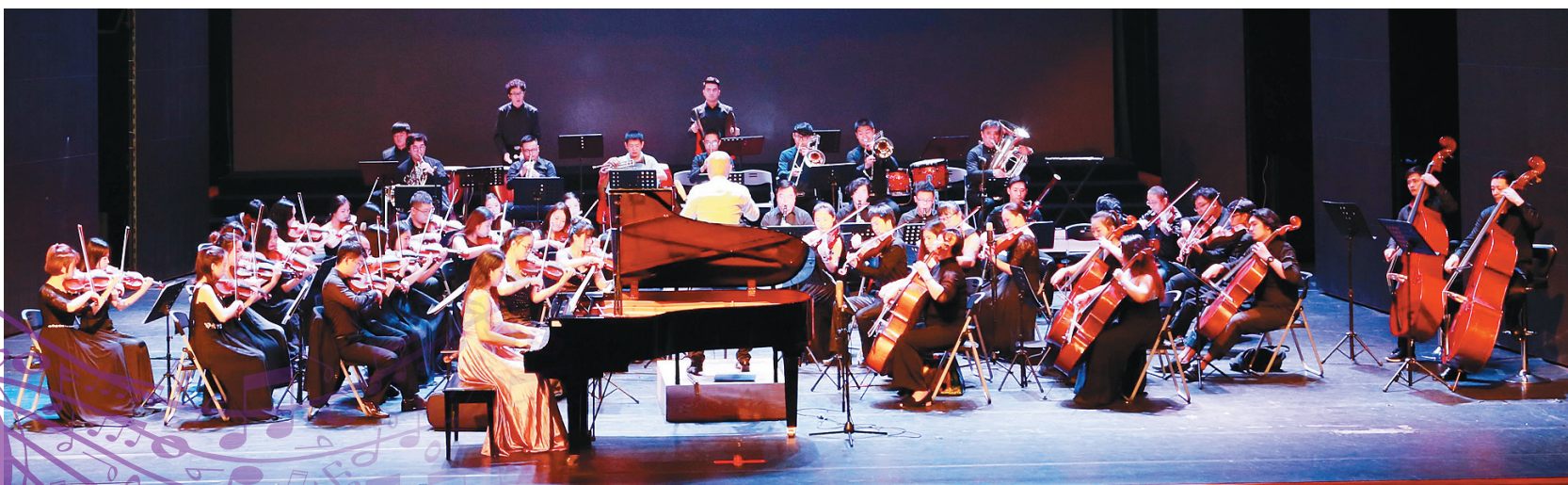
海南大学管弦乐团在演出

音乐界中对于交响乐有一种共识：交响乐是现当代高雅艺术中最优秀的形式体裁。说到海南本土的高雅音乐艺术，就不得不提海南大学国乐团以及海南大学管弦乐团这两支乐团。新春之际，他们如期带来了“华乐盛典”海南大学2017年新年音乐会。