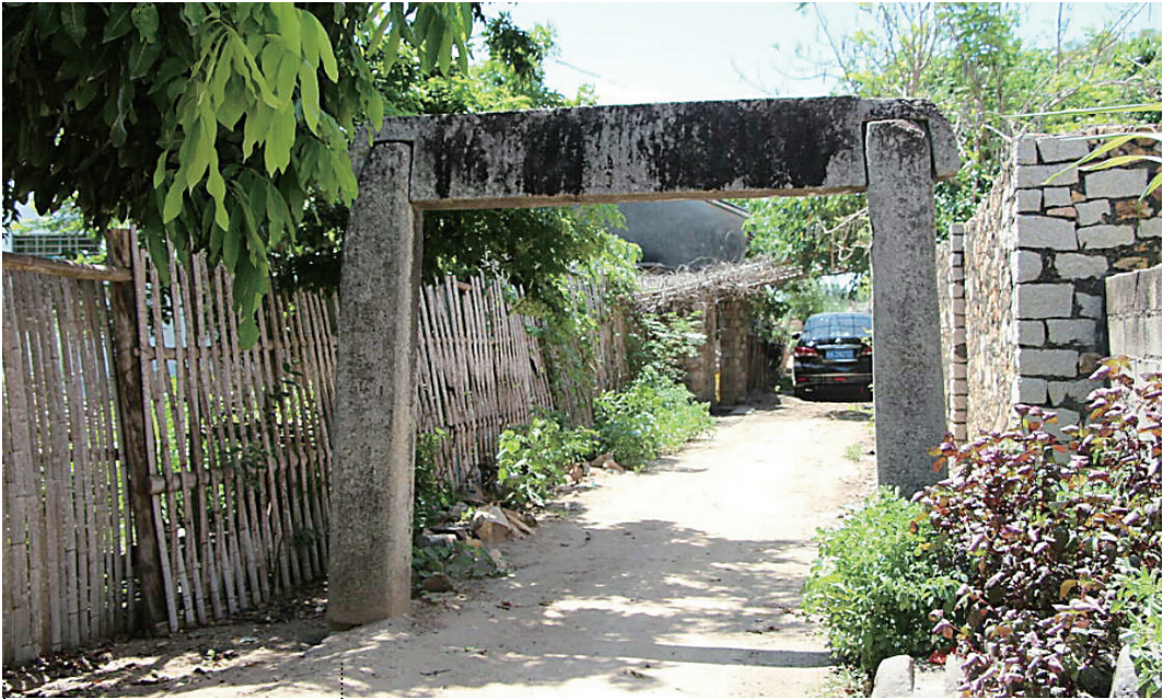
位于昌江海尾大安大村中的“恩荣”石牌坊。

再访大安村，找到王朝典，终于得见《赠冠带土官王子抚黎序》布幛的真貌——在一块长273厘米、宽141厘米的绣花衬布之上，缝了一块长207厘米、宽102厘米的红布，上面的文字密密麻麻，约有1400字，用金水书写，但多数已经褪色，