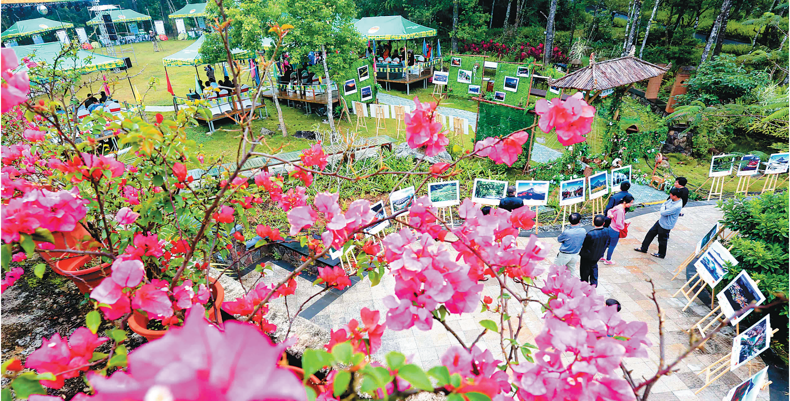
3月27日,五指山市水满乡全域旅游品牌发布会在亚泰雨林度假酒店举行。

海口市旅游委相关负责人介绍,火山口园区内的第三卫生间是海口旅游景区首个投入使用的第三卫生间,之后还将以此为样板,在海口的旅游景区推广建设。