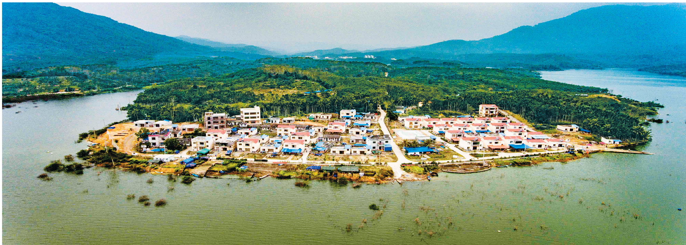
琼中和平镇埭对村原来是一个边远的贫困黎族村落,近年来在政府的帮助和村民的努力下,村容村貌发生了巨变。