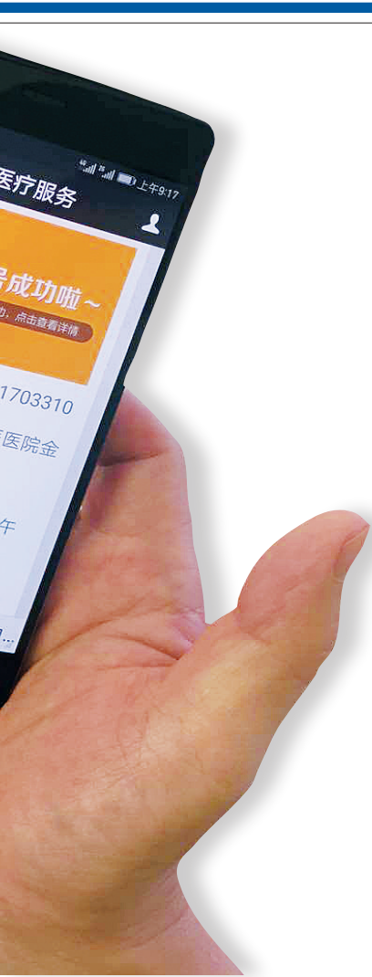
患者手机上通过医院微信公众号成功挂号。

除了方便患者就诊,海南很多医院推出的互联网便民服务平台还不断拓展服务项目。如海口市人民医院的互联网便民服务平台就集中了全市医院的优质专家和服务资源,为公众提供居家诊疗咨询、检查检验报告自助查询、电子病历自助查询、送药上门等服务功能,改善群众就医体验。