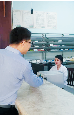
患者手机上支付费用后,可直接到药房窗口取药,节省了排队等待的时间。