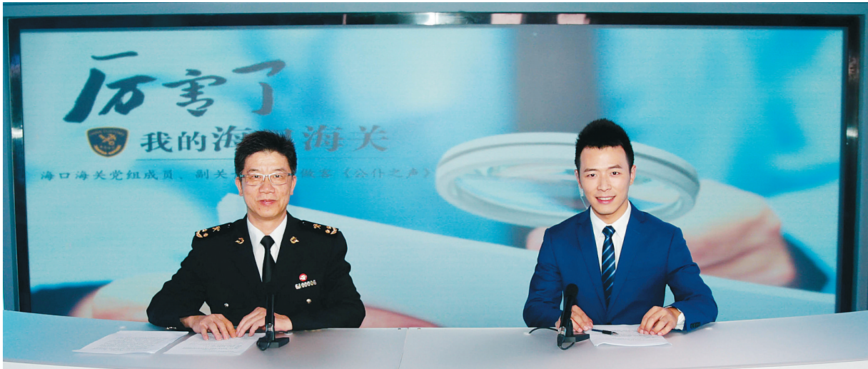
海口海关副关长陈针做客《公仆之声》栏目。

为了达到“再压缩三分之一”这个目标,海口海关今年将如何落实这句承诺,兑现承诺后又给海南外贸发展带来怎样的影响?离岛免税、整车进口、医疗旅游等这些“海南特色”,如今发展状况如何,给普通百姓的生活带来哪些影响?日前,海口海关党组成员、副关长陈针做客《公仆之声》栏目,与网友互动交流。据陈针介绍,海口海关通过