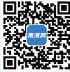
南海网视频频道出品 扫码可看访谈视频