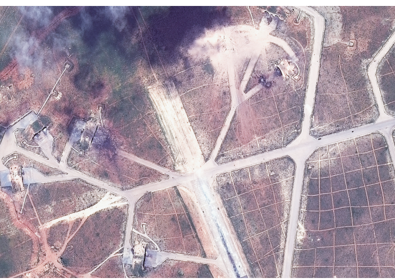
这张由美国DigitalGlobe公司4月7日提供的卫星照片显示的是遭军事打击后的叙利亚中部霍姆斯省的沙伊拉特军用机场。

停泊在地中海东部的两艘美国军舰7日向叙利亚霍姆斯省沙伊拉特空军基地发射了59枚战斧巡航导弹。美国“战斧”挥舞下,俄在叙境内部署的先进防空导弹S-400并未作出反应。俄罗斯国防部发言人科纳申科夫7日说,俄方将从8日零时起,中止俄美叙利亚沟通热线。