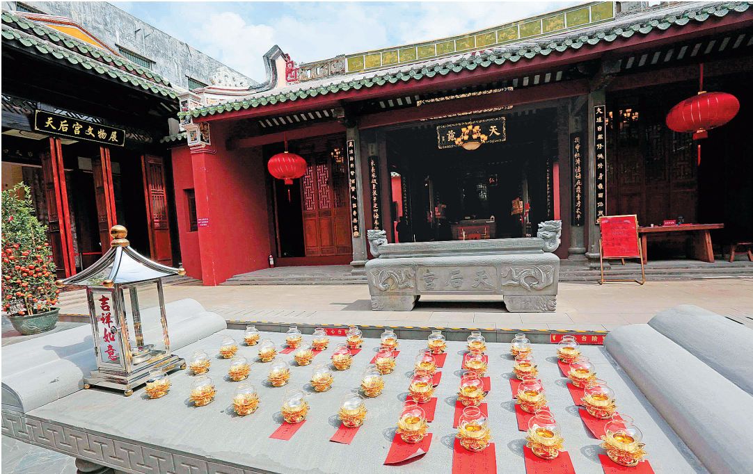
修缮一新的天后宫。