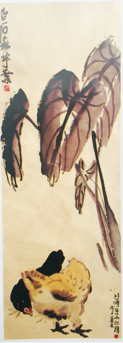
双鸡图》给鹿回头招待所。周恩来总理赠徐悲鸿、齐白石两人合作的《芋叶