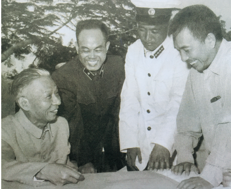
1960年二月,国家主席刘少奇在三亚看望守岛官兵,查看海防地图。右一为广东省委第一书记陶铸。