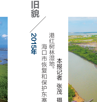
旧貌 2015年 港红树林湿地。 海口市恢复和保护东寨