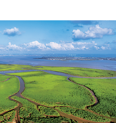
旧貌 2015年 港红树林湿地。 海口市恢复和保护东寨