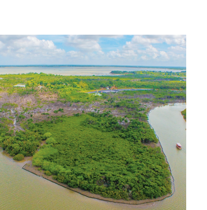
旧貌 2015年 港红树林湿地。 海口市恢复和保护东寨