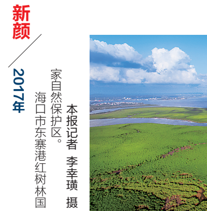
新颜 2017年 家自然保护区。 海口市东寨港红树林国

对于新能源公交车的环保效应,业内人士表示,“按每天行驶100公里算,纯电动公交车相较于柴油公交车,一年一氧化碳可以减少约144千克,二氧化碳减少约2520千克,颗粒物减少11千克左右,碳氢化合物减少约13.3千克。”这仅仅是一辆车大气污染物的减少量,如果全市公交车都换成纯电动车,那么对环境质量的进一步提升将更加显著。(本报海口4月12日讯)